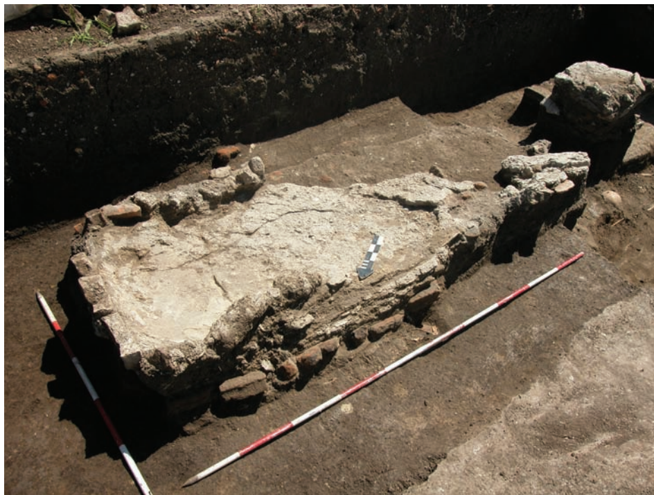
2. Правоугаона конструкција јужно од цркве. 2. Rectangular structure south of the church.