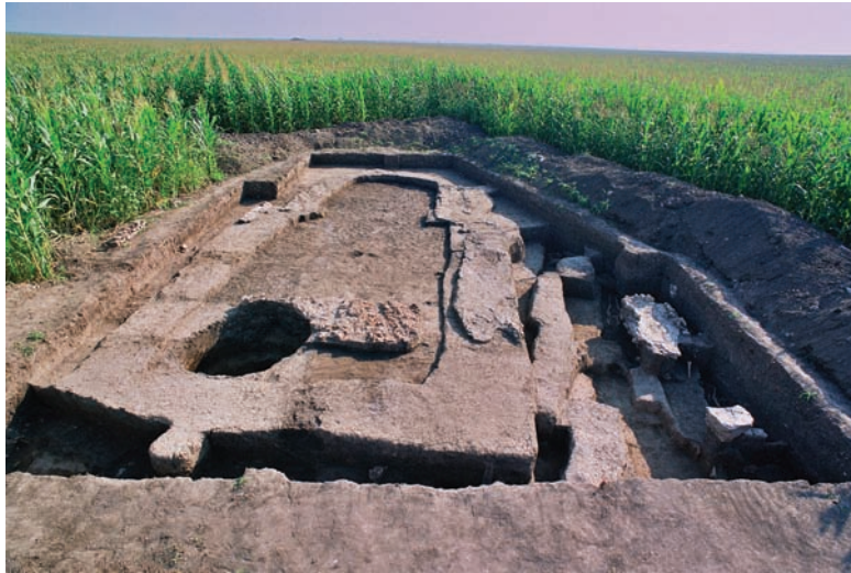
1. Омољца, локалитет Преко Слатине, археолошки ископ из 2005. 1. Omoljica, site Preko Slatine, area excavated in 2005.