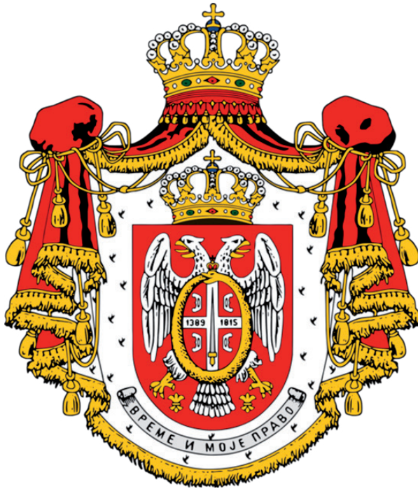
Краљевски грб Обренивића, извор: File: Coat of Arms of the Obrenovic Royal Family.png - Wikimedia Commons