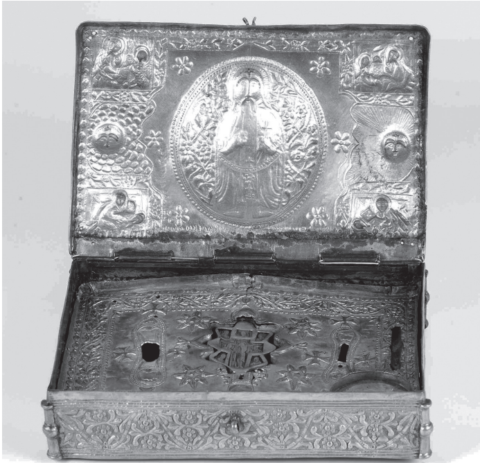
Сл. 1 Таксидарски кивот манастира Свети Прохор Пчињски, крај 19. века, сребро, ризница манастира.