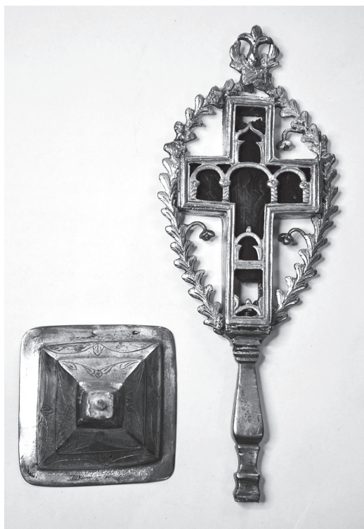
Сл.8 Ливени расклопиви крст из збирке Музеја примењене уметности, инв. бр. 1134