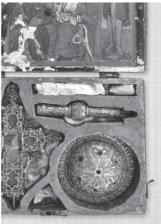
Сл. 9 Таксидарски кивот из ризнице манастира Хиландара. (М. Брмболић, Крстови из ризнице манастира Хиландара , Београд, 2016, 126.)