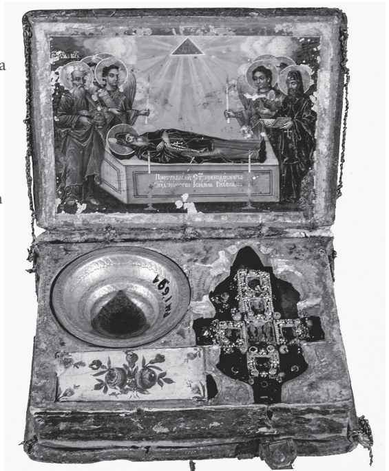
Fig. 10 A collection box reliquary from the Rila Monastery with the image of the Ascension of St John of Rila, by the zograph Dimitar Molerov, dating from the first half of the 19th century, the monastery treasury.

Сл. 10 Таксидарски кивот из Рилског манастира са представом Успења Светог Јована Рилског, зограф Димитар Молеров, прва половина 19. века, ризница манастира.