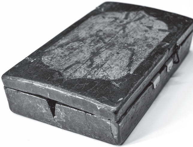
Сл. 3 Затворени таксидарски кивот у форми књиге из збирке Народног музеја у Београду, почетак 19. века, инв. бр. 5791, Народно музеј у Београду.