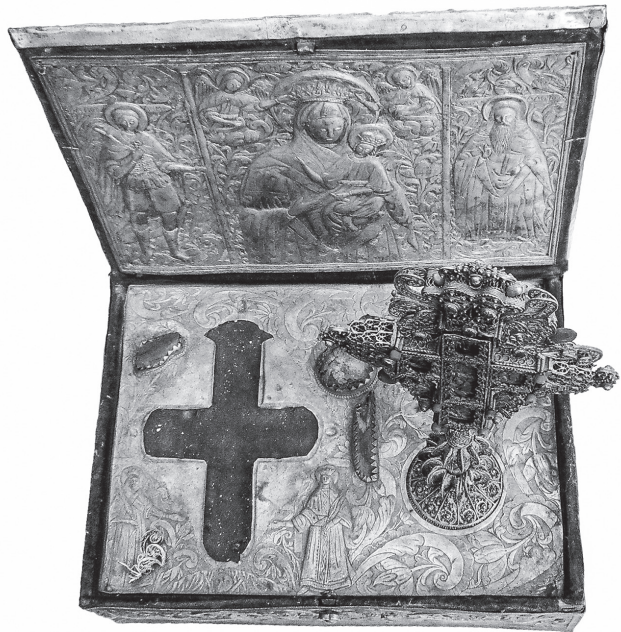
Сл. 2 Таксидарски кивот јеромонаха Аврама Бачковског из 1843. године, сребро, ризница манастира Бачково.