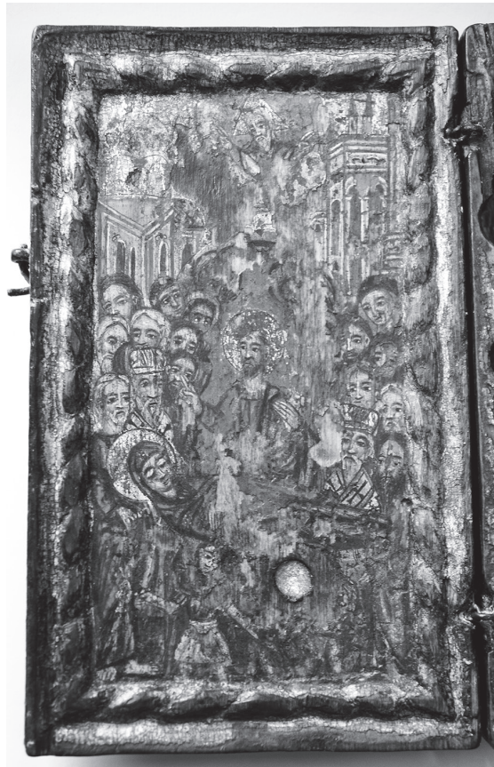
Сл.4 Представа Успења Пресвете Богородице у унутрашњости кивота, непознати зограф са југа Балкана, почетак 19. века.