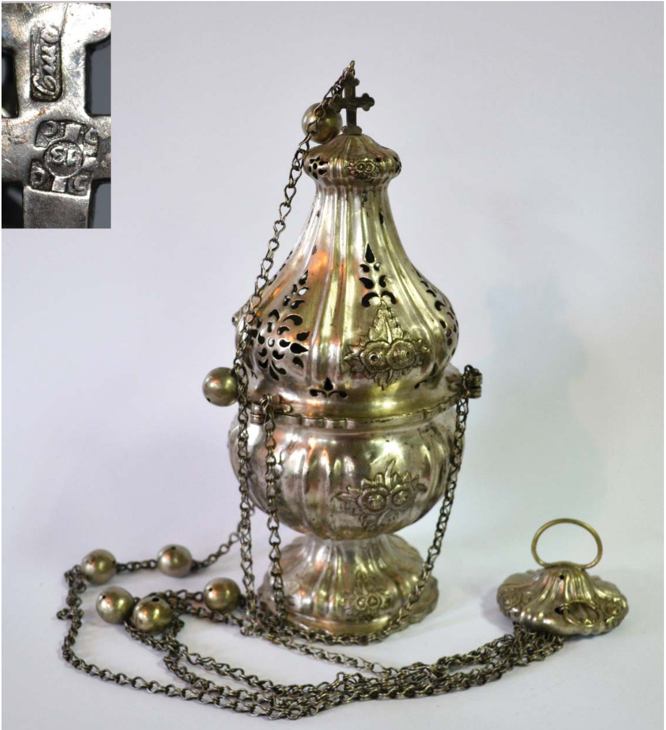
8. Сребрна кадионица, дар чачанског екмеџијског еснафа и „друштва механичко-кавеџиског“, рад златара Николе Стојисилјевића, 1868