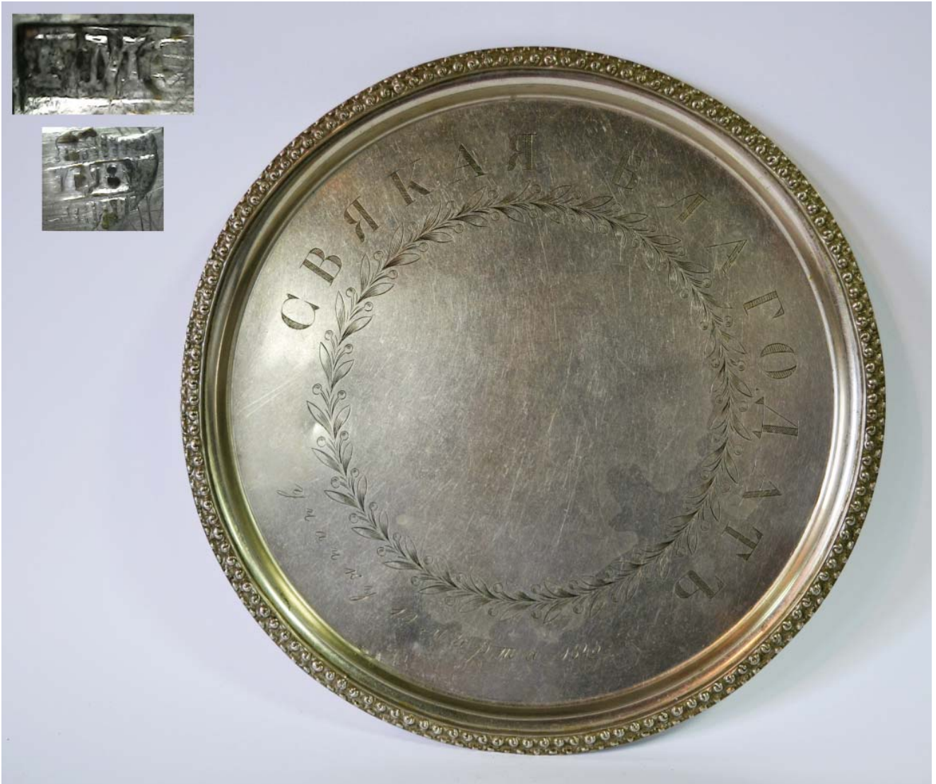
5. Тас од алиаке, приложен цркви у Чачку 1845