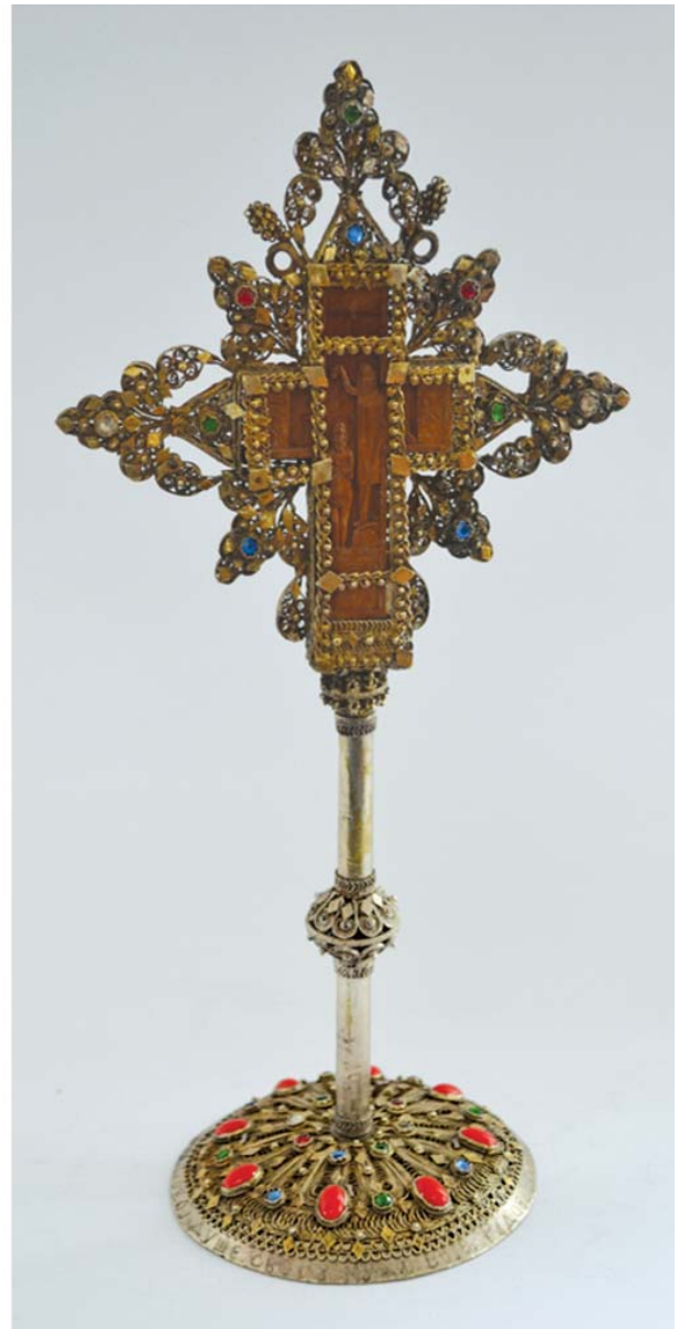
12. Silver filigree cross, donation of merchant Ilija Krivačić, 1911 (left); silver filigree cross, donation of widow Živana Radovanović, 1939 (right)**