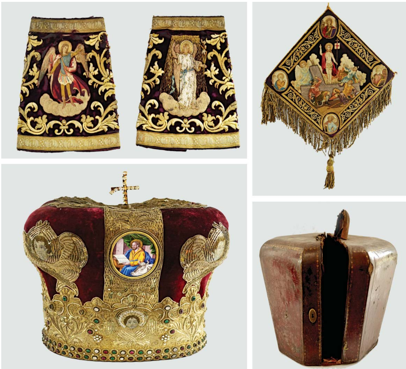
2. Делови архијерејског орнаџа ужичких епископа: пар наруквџца (горе лево), набедреник (горе десно) и архијерејска мџтра са припадајућом кожном куџијом (испод)