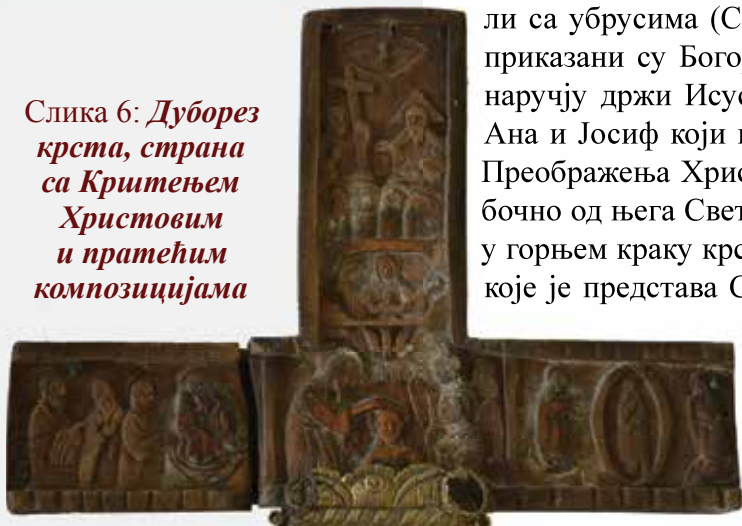
Слика 6: Дуборез крста, страна са Крштењем Христовим и пратећим композицијама

ли са убрусима (Сл. 6). У левом краку је сцена Сретења Господњег, приказани су Богородица са Светим Симеоном Богопримцем који у наручју држи Исуса Христа, док су иза Богомајке Света пророчица Ана и Јосиф који носи две голубице. У десном краку је сцена Преображења Христовог, представљен је Христос у мандорли док су бочно од њега Свети пророци Мојсије и Илија. Изнад сцене Крштења у горњем краку крста приказана је Богородица шира од Небеса, изнад које је представа Свете Тројице, Бог Отац приказан је као старац са брадом и троугаоним нимбом, Бог Син са Крстом као оруђем страдања и спасења, док је Бог Дух Свети представљен у виду голуба који лебди изнад њих. У доњем краку крста је сцена тријумфалног Васкрсења Христовог из гроба са крсним барјакком. На другој страни је у средишту приказано Распеће Христово коме присуствују Богородица и