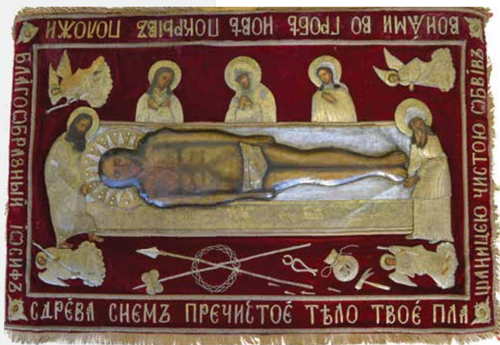
Слика 43: Плаштаница, руска империја, половина XIX века

опсечене тако да прати контуре тела и зашивена на правоугаони комад сомота окер боје. 158 У угловима су насликани овални медаљони са попрсјима јеванђелиста, док је бордура украшена сликаним мотивом вино-