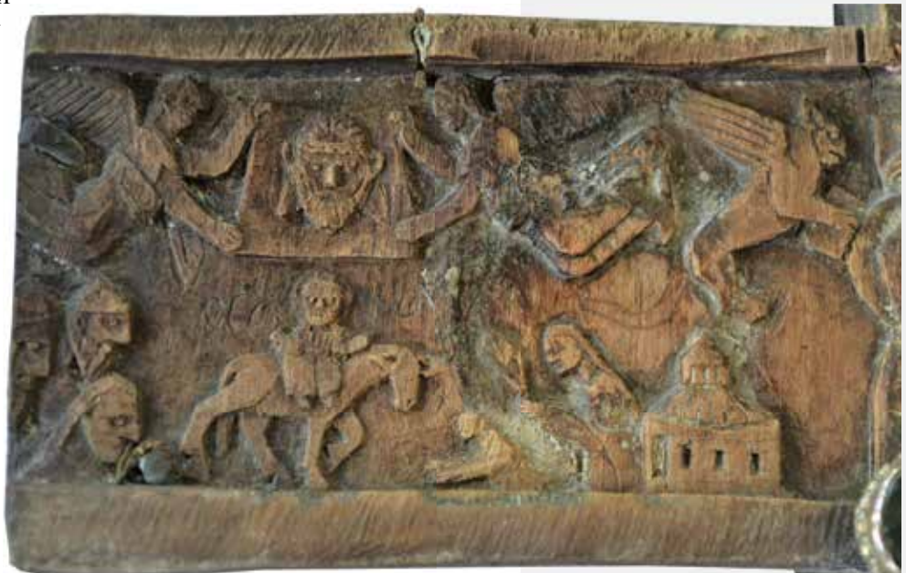
Слика 10: Детаљ дубореза, Улазак Господа Исуса Христа у Јерусалим, Мандилион, црква Светог гроба