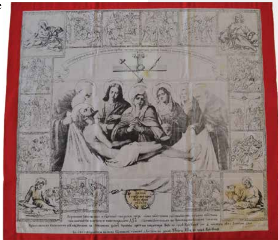
Слика 2: Антиминс Епископа шумадијског Саве освештан 1995. године, отиснут са клишеа Паје Јовановића изведеног крајем XIX века

Поред овог у Духовској цркви у Крагујевцу сачувана су два антими́нса које је освештао Епископ шумадијски Сава. Први је отиснут на ланеном платну са црвеном бордуром и поставом, а освештан је 1995. године у Саборној цркви у Крагујевцу (Сл. 2). 19 Други је такође на белом ланеном платну са зеленом поставом и бордуром, освештан 1997. године у Крагујевцу. 20 Ови антими́нси остиснути су са клишеа који је по наруџби вршачког епископа Гаврила Змејановића извео академски сликар Павле Паја Јовановић крајем XIX века. На антими́нсу је традиционално у центру приказано Полагање тела Христовог у гроб, у угловима су представе јеванђелиста, централну сцену окружује дванаест сцена које почињу Тајном вечером и приказима Страдања Христовог, те потом Распећа и Васкрсења. Предложак антими́нса у великој