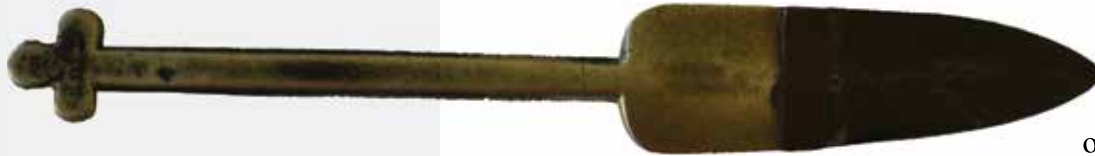
Слика 16: Копље, сребро и гвожђе, половина XIX века

плавог бруката квадратног облика, опшивен златном паспулном траком од које је начињен и једноставан крст у средини. Произведен је