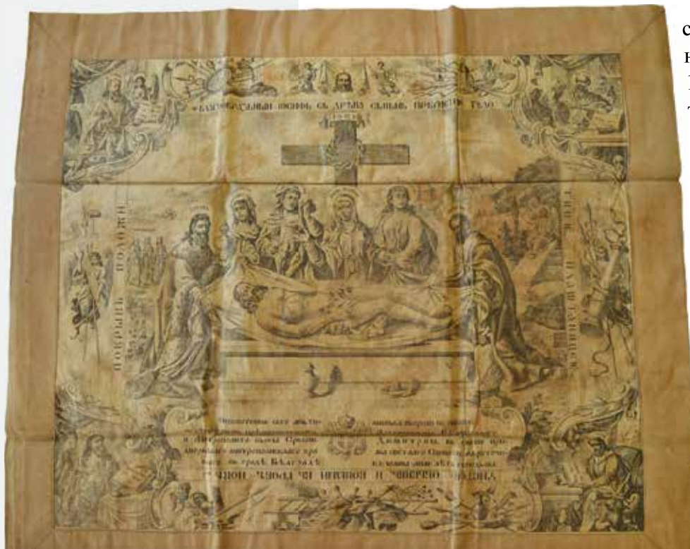
Слика 1: Антиминс Митрополита српског Димитрија освештан 1911. године, отиснут са преуређеног бакрорезног клишеа Георга Николаја из XVIII века

ну благочестиве цркве уређено, како што је олтар с чесном трапезом, на којој лежи свјато евангелије са сребром обложено и позлаћено; равно и окрут церковни јест доста знаменит како и проче друге вешчи во олтару принадлежашче. 10 Деценију након његове посете пописом из 1836. године наведени су предмети које је црква Силаска Светог Духа тада поседовала. 11