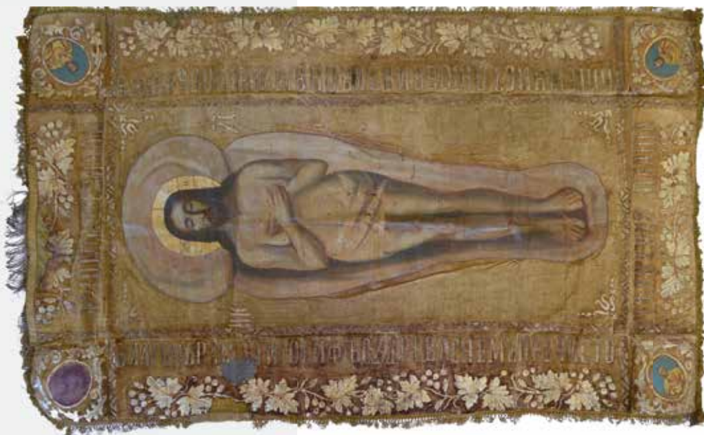
Слика 42: Плаштаница, руска империја, XIX век