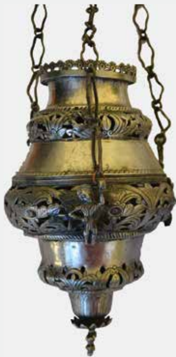
Слика 40: Два кандила јерусалимског типа, сребро, XIX век

секретара књаза сербскогъ днлоша обреновића ꙗ приложисе цркви крагевачкон одъ ндѣнїа собственог 1827 года.