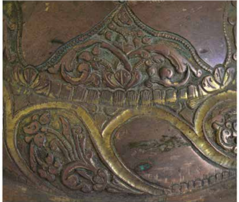
Слика 11: Детаљи стопе и османско-персијски декоративни мотив типа buta (десно)