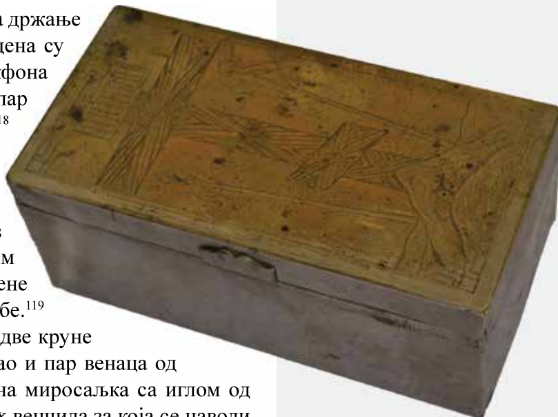
Слика 36: Прибор за криштење, руска радионица, крај XIX века

Крајем XIX века у црквеном поседу су биле две круне за венчања и игла за миросање од сребра, као и пар венаца од жутог плеха, четири звонца од месинга, једна миросаљка са иглом од плеха и тацном од порцелана. 120 Пар сребрних венчила за која се наводи да их је приложио кнез Милош, пренет је из Старе цркве у Крагујевцу у манастир Каленић приликом оснивања епархијске ризнице (Сл. 37). 121 Начињена су од сребра у форми једнаких затворених круна са крстом на врху. 122 Венчила се састоје од почелице у форми ажуриране траке укра-