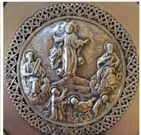
Слика 29: Детаљ сребрне рипиде, медаљон са композицијом Срећења Христовог