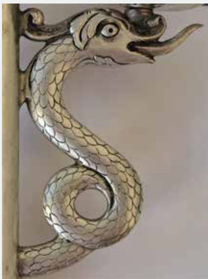
Слика 18: Детаљ петохлебнице, зооморфни мотив на држачу за свеће