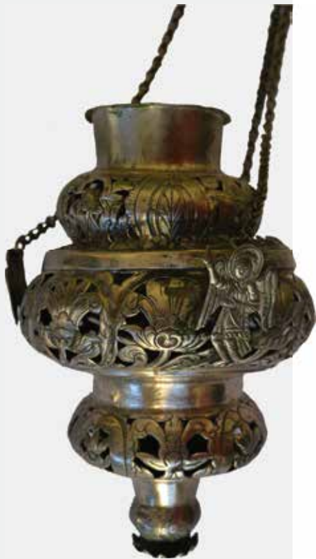
Слика 39: Кандило од сребра, дар руфета туфегзијско-налбантског, 1831. године