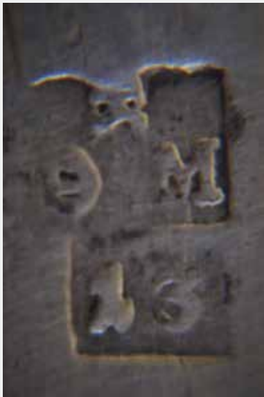
Слика 34: Пунце мајстора литијског крста и рипида, ознака финоће са иницијалима