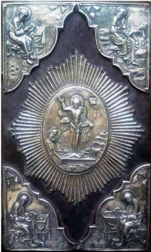
Слика 3: Престоно Јеванђеље штампано у Москви 1809. године са сребрним оковом израђеним у време подизања цркве.

Сребром оковано Јеванђеље које помиње Јоаким Вујић из времена настанка цркве је сачувано. Попис из тридесетих наводи да црква поседује четири Евангелија. 24 Попис из шездесетих година XIX века појашњава претходни навод, три Јеванђеља су престоног типа на Велико коло, једно је мање, док су два била у сребрном окову. 25 Крајем XIX века пописано је једно половно Јеванђеље на Великом колу, пресвучено кадифом и сребром оковано. 26 Најстарије сачувано Јеванђеље потиче из 1809. године, и штампано је у Московској синодалној типографији. (Сл. 3). Повезано је кадифом са сребрним апликацијама без пунци и рад је балканских мајстора. У средишту је у овалном картушу представа Васкрсења Христовог, док су у угловима јеванђелисти, сигнирани и са њиховим симболичким персонификацијама. На полеђини је крст на Голготи са оруђима страдања, док су у угловима стопе намењене постављању Јеванђеља на Часну трпезу. Преостала Јеванђеља Старе цркве су типски руски импорт, произвођен у великим серијама, којим је Српска црква крајем XIX века често била снабдевана. 27