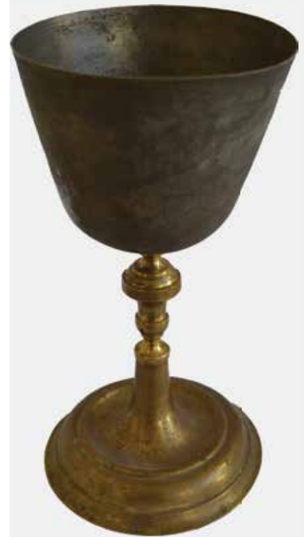
Слика 13: Путир, крај XIX века