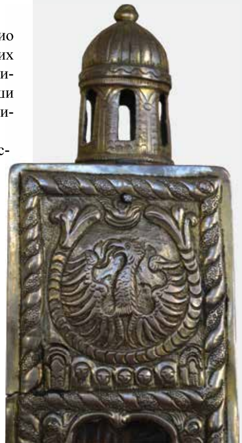
Слика 9: Детаљ окува, представа орла и мотив куле – Светогропске ротонде