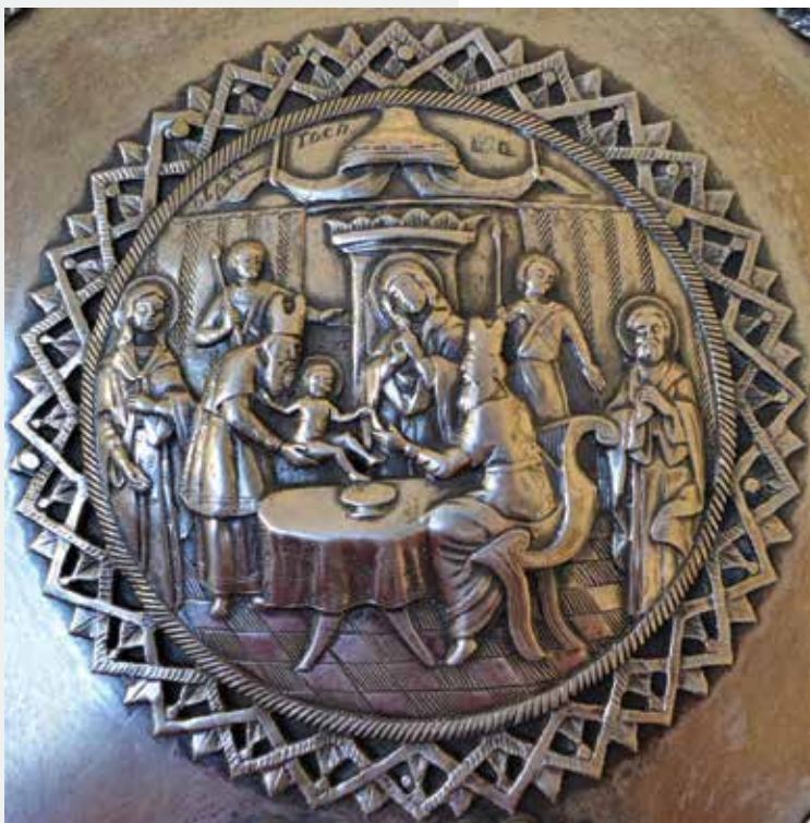
Слика 28: Детаљ сребрне рипиде, медаљон са композицијом Обрезања Господњег

На другој рипиди су приказани Крштење Христово у Јордану (богомак. госп.), које обавља Свети Јован Крститељ у присуству анђела