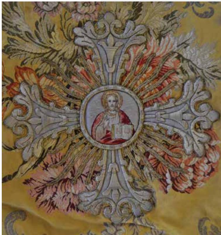
Слика 45: Детаљ брукатног фелона, везени крст и медаљон са представом Христа Сведржитеља, крај XIX века