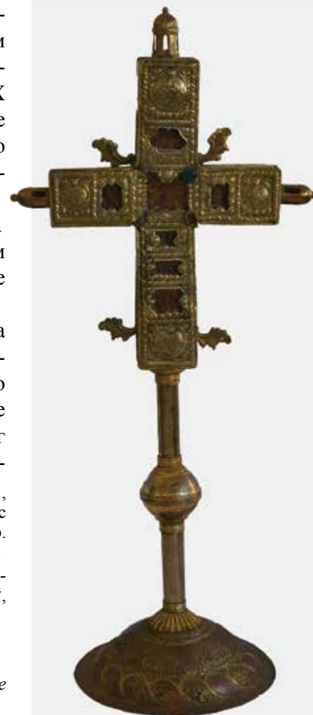
Слика 5: Престони крст, половина XVIII века