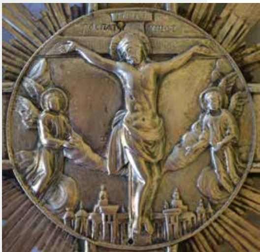
Слика 35: Детаљ литијског крста, медаљон са композицијом Распећа Христовог

ставама Јерусалима, попут Жефаровићевог уочава се у приказу ведуте Светог града у подножју композиције Распећа Христовог (Сл. 35). 109 Троугаона представа Новозаветне Свете Тројице на једној од рипида доследно цитира начин њиховог приказивања формулисан унутар оквира православне уметности барока. 110 Иконографске особености представа на рипидама и литијском крсту указују такође да радионицу у којој су настали треба тражити на ужем подручју Карловачке митрополије или Аустријског царства.