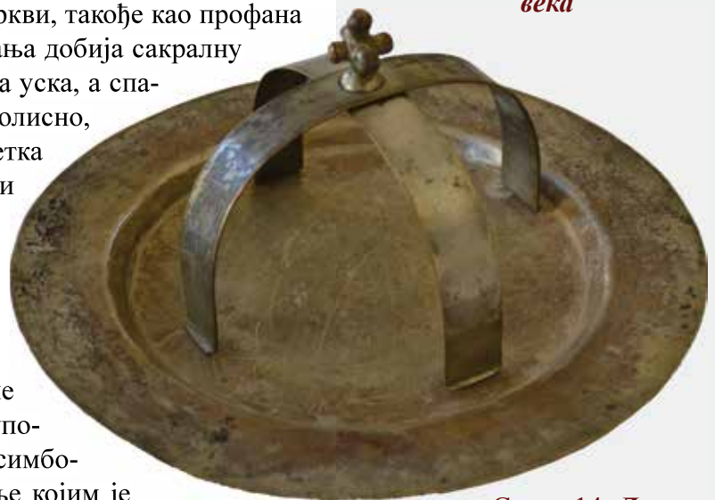
Слика 14: Дискос са звездицом, почетак XX века