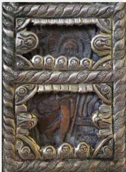
Слика 8: Детаљ окова са светитељским главама, голубом Светог духа, Серафимима и Мандилионом; Детаљ дубореза: тријумфално Васкрсење Христово

Томино спојене у јединствени наратив. У левом краку крста је представа Уласка Господа Исуса Христа у Јерусалим, у средишту је приказан Христос који јаше на магарету, бочно од њега овлаш је урезана реч „осана“ којом га Јерусалимска деца дочекују певајући „Осана на висини, благословен који долази у име Господње“, мноштво јерусалимског народа приказано је у форми профилних глава. Изнад ове сцене приказана су два анђела која држе развијен нерукотворени образ – Мандилион, док је у десном углу представа Светогропске ротонде. У доњем краку крста назире се сцена Благовести.