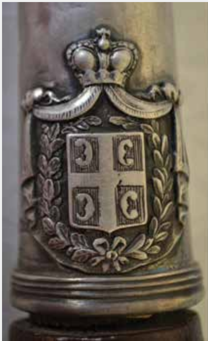
Слика 27: Детаљи дршке, зрб Кнежевине Србије и натпис са годином прилагања