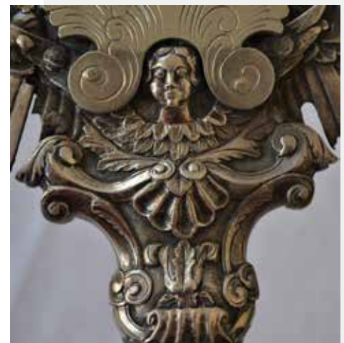
Слика 26: Детаљ, декоративни носач рипида и крста