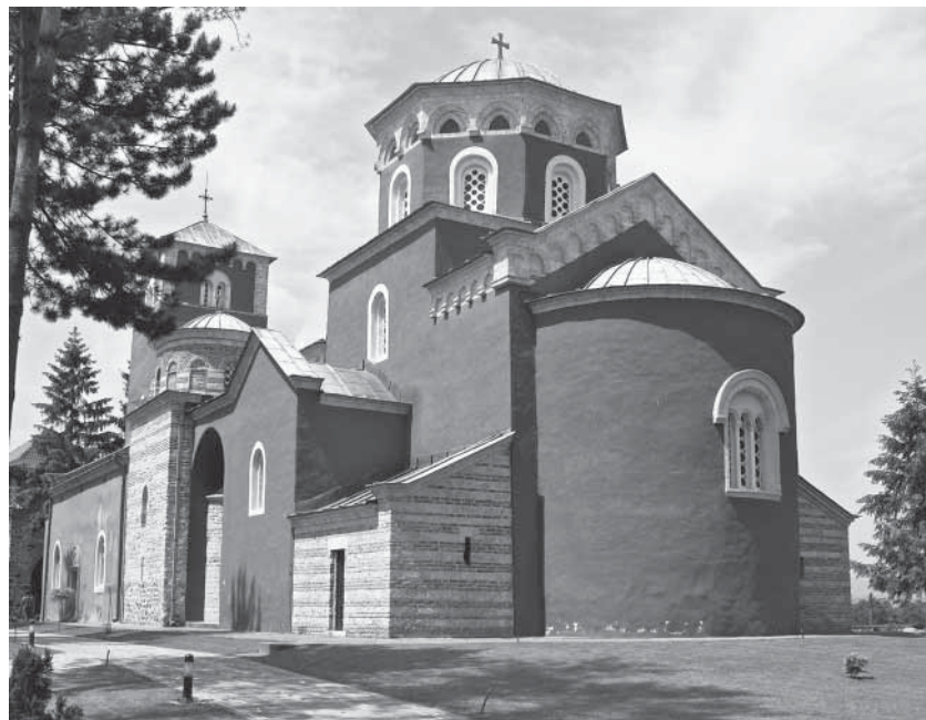
Сл. 1. Жича, црква Вазнесења Христјовој, изглед са југоисточне стране после савремених конзерваторских радова

Жичка црква је остварење произишло не само из рада средњовековних мајстора већ у истој, ако не и већој мери, и из многобројних каснијих средњовековних оштећења и преправки, интервенција и обнова током XIX и почетком XX столећа, као и из обимних савремених рестаурација (сл. 1). 16 Непобитан је, међутим, закључак да је данашња грађевина задржала форме које су дефинитивно биле уобличене тек након што се Сава 1219. вратио из Никеје и убрзано руководио радовима на њеном довршењу. 17 С друге стране, у изворима је наведено да је изградња цркве ошћичела знајно раније , у време док је Стефан носио титулу великог жупана, а Сава био старшина Студенице. 18 Преведено у апсолутну хронологију, то би значило најкасније од 1206/1207, датума до којег је Стефан засигурно по други пут стекао владарско достојанство, до 1217/1218, када је по налогу Хонорија III примио краљевске инсигније. 19 Реч је, дакле, о интервалу трајања изградње , иако извори такође доносе и податак да црква још увек није била живописана, односно у потпуности довршена, приликом званичног прогла-