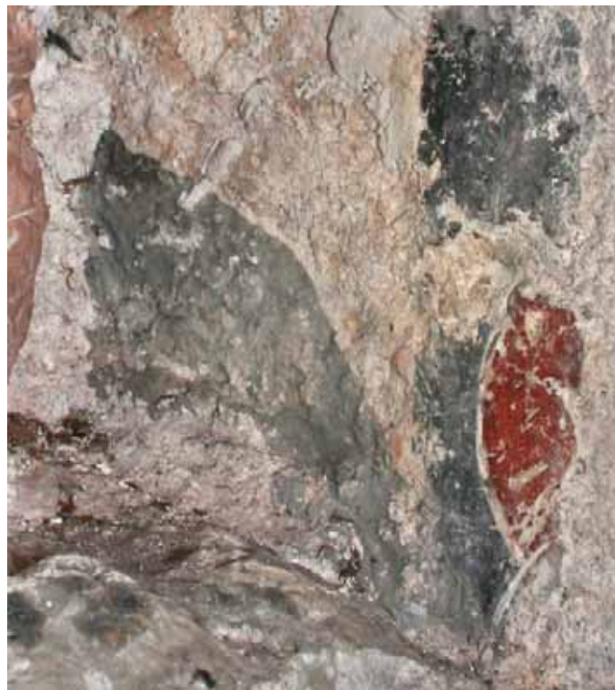
Сл. 13 . Остатак сликарства на западној фасади старе цркве.

Поствизантијску обнову цркве Светог Николе, започету у другој половини XVI века, наставили су сликари који су у XVII веку живописали певницу и део западног зида уз њу. Ако је храм био осликаван у XV столећу, могуће је да је у првом наврату обновљен само живопис главног брода, а да су потом из-