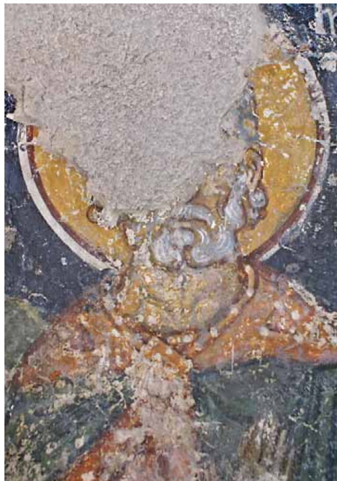
Сл. 3. Свети Мина Египћански Fig. 3. St Menas of Egypt

ника за Христа, слављеним, као и он, 11. новембра, 11 јасно је да управо њима припадају два оштећена попрсја у наставку низа. Први од њих одевен је у зелену тунику и црвен плашт опточен златом и бисером, тамне је косе и с бисерним венцем на глави. Четири поменути мученичка попрсја одвојена су вертикалном бордуром од представе јеванђелисте насликане уз саму ивицу свода певнице. Од те представе преостали су само део дрвене столице и јеванђелистине ноге на супедиону у доњем делу поља и сегмент неба из којег излеће крилати ауторов симбол у горњем делу. Због сасвим фрагментарне очуваности фреске није могуће с поузданошћу утврдити идентитет тог јеванђелисте. Знатно је боље сачувана представа јеванђелисте Јована с необичним натписом [ΙΩΒ(ΛΝΉ)], насликана источно од певнице (сл. 4). Времешни Богослов приказан је како у патмоској пећини записује у кодекс почетак свог јеванђеља на грчком језику [⟨E>v | <α>ρχ|<η> ...]. Из сегмента неба спушта се ка светом Јовану његов симбол – орао с књигом у канџама. Уска површина између јеванђелиста, над теменом свода певнице, покривена је орнаменталним пољем, а изнад кордонског венца, у трећој зони живописа, наслика-