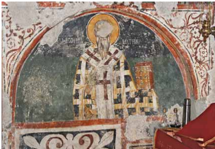
Сл. 6. Свџти Јован Милостиви Fig. 6. St John the Almsgiver

мрких сенки непрозирно су дубоке, а инкарнат је некако тврд и металног сјаја, пепељаст у боји. Ликови су прилично грубо исцртани, делују укочено и схематизовано. Увећаних су глава у односу на тело, сапетих и неприродних ставова, често без праве племенитости у поставци. Извео их је сликар без великог дара и нарочитог уметничког замаха, који није умео да подари звонкост боји. Колористичка сазвучја сирова су му и заморна, а сликана материја је без изразитије лепоте. 15 Једноличност, сувоћа и неинвентивност осећају се и на деловима његовог орнаменталног сликарства у зони сокла, знатно вишег у певничком трансепту но у подужном броду и олтарској апсиди.