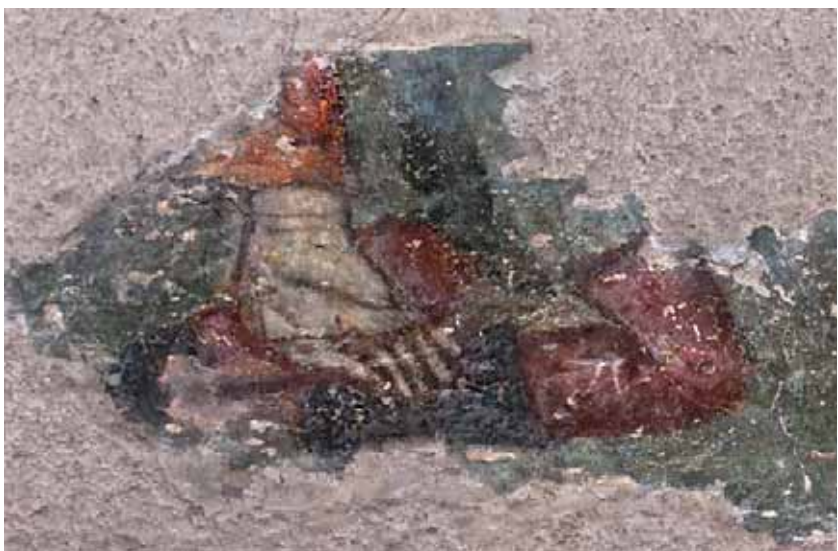
Сл. 8. Остатак сцене Жртвоиношења Авраамовој Fig. 8. Remnant of the Sacrifice of Abraham

сан је ортографски нетачно, али не без знања језика. Заправо, речи су забележене према изговору, по својој фонетској вредности, дакле уз примену „фонетског правописа“. То показује да је реч о мање образованом зографу Грку. 16 О томе да је сликар био Грк, насупрот закључку неких ранијих истраживача, 17 додатно сведоче грешке које је направио исписујући на једном од свитака српскословенски текст, јер наш стари језик очевидно није добро познавао. Цитат из псалтира (Пс 18/19, 1) на свитку у рукама пророка Давида тачно је написан, вероватно према предлошку који је сликар добио [н(ε)β(ε)α | повѣ|дѣ|тъ сл|авоу в(о)жи|ю]. Текст на свитку у рукама Соломоновим, међутим, неразумљив је [сази|де вѣ 18 | вѣ вѣ|скли|скно|в(ε). (ε)] (сл. 12). Очевид-