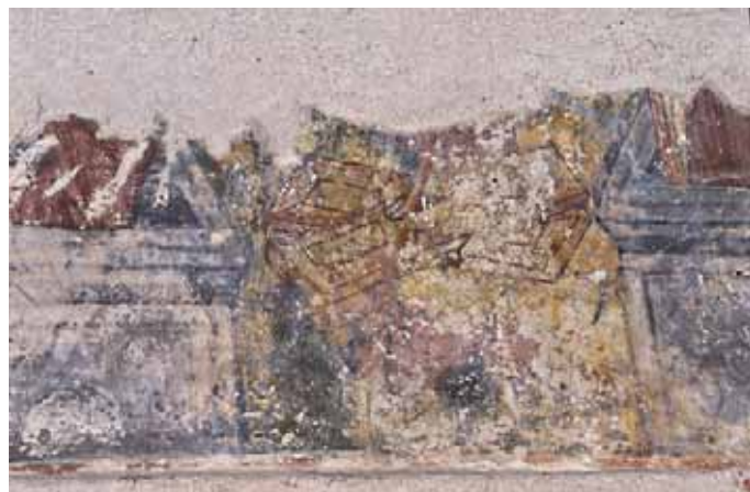
Сл. 5. Силазак у ад, геѣтѣл Fig. 5. Descent into Hades, detail

фигура клечала је на земљи, а носила је црвене чакшире и црне чизмице. С обзиром на место у храму на којем је сцена насликана – у олтару, пред жртвеником – реч је несумњиво о представи Жртве Авраамове. 13