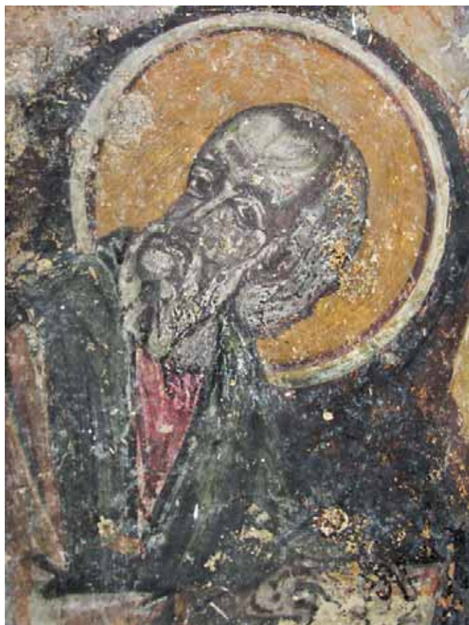
Сл. 4. Свѣтѣи Јован Боѣослов Fig. 4. St John the Theologian

ображења у Будисавцима из 1568. године. Творци те две сликарске целине потекли су свакако из једног од уметничких кругова које је патријарх Макарије окупио око себе у Метохији. Прасквичко сликарство чини се нешто сигурнијим у цртежу, зрелијим и колористички прочишћенијим. Нажалост, заснованије и одређеније судове о том старом живопису није могуће доносити због његове фрагментарне очуваности.