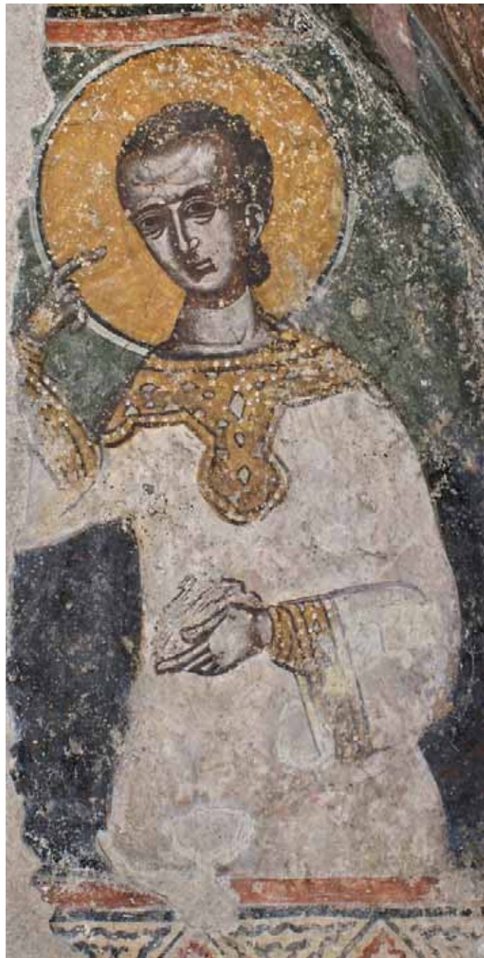
Сл. 10. Свети Кирик Fig. 10. St Cyric