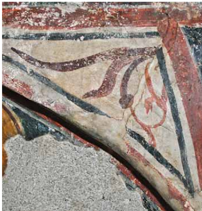
Сл. 11. Орнаментално поље на којем је спојница слојева Fig 11. Ornamental field with the joint of two layers