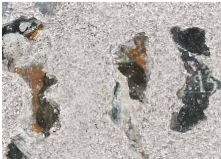
Сл. 7. Остаци лика свџтој Азарије Fig. 7. Remnants of the representation of St Azarias