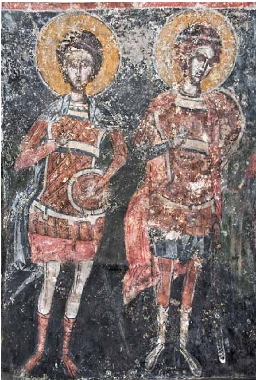
Сл. 9. Свети Прокопије и свети Нестор (?) Fig. 9. St. Prokopios and St Nestor (?)