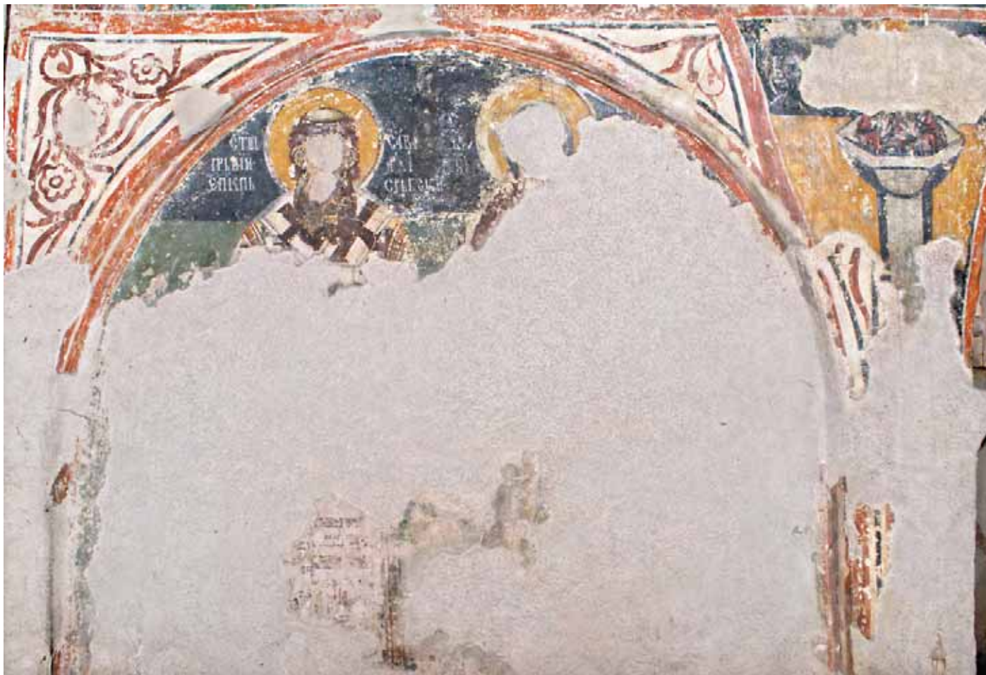
Сл. 1. Свети Сава Српски, свети Симеон Српски и нејрејкознајтии свети стилоитник – северни зид старој западној бравеја