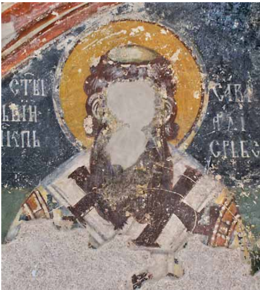
Сл. 2. Свети Сава Српски, детаљ сл. 1 Fig. 2. St Sava of Serbia, detail of fig. 1