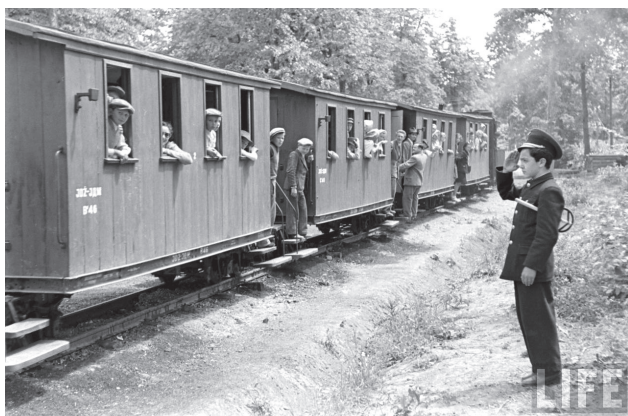
Слика 3 Задатак пионира је да добро уче

Како би пруга постала пионирска држава у малом, новинске рубрике најављују и додатне активности којима се боравак и рад пионира на овом месту обогаћују и оплемењују. „Да би се пионири што пријатније осећали, оспособљено је поред пруге већ 11 шумских павиљона, сала за биоскоп и зграда која ће моћи да пружи 360 кревета за одмор пионирима после трчања и играња.” 21 У том смислу се у блиској будућности најављује и изградња пионирског града, као и претварање голф терена у полигоне за вежбу и такмичења пионира (слика 3).