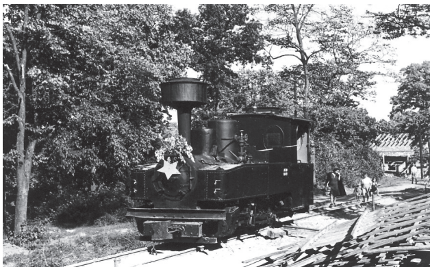
Слика 1 Парна локомотива 99.4-029 на Пионирској прузи; власништво Железничког музеја у Београду

На обронцима Кошутњака, у правцу исток-запад, године 1947. почела је да се прави прва пионирска железница у нашем региону. Најављујући њену изградњу, овако је са скупа бригадира априла исте године извештавала „Борба”: „Пруга ће пролазити кроз живописне и сликовите пределе почев од Бановог брда преко врха Кошутњака и Кнежевца до гребена изнад Кијева... Пионирима излетницима пружаће се из њиховог воза диван поглед на далеку Фрушку Гору, високи Цер, Саву и Авалу...” 11 (слика 1).