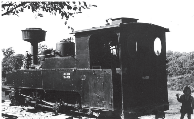
Слика 2 Фотографија Парне локомотиве 99.4-029 Железничар на пионирској прузи - добар ученик – добар пионир 17

Пионирска железница, која води у Пионирски град, у то царство децје маите, - то је била лепа успаванка, лепа децја бајка са којом су деца успављивана и варана у блиској прошлости код нас. Данас то више није бајка – то постаје стварност. 18