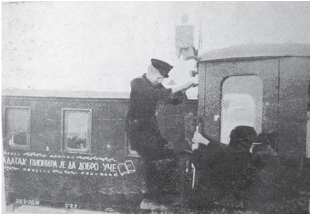
Слика 6 Илустрација из магацине Life , доступно на Интернету. Преузето из базе Железничког музеја у Београду

Када у Google претраживачу покушате да се информисете о Пионирској железници у Београду, а пре свега о њеном изгледу, прво на шта се наилази су фотографије из магазина Life ! Чињеница да је амерички првобитно недељник, а касније месечник, који је и сам престао да постоји 2000. године, показао веће интересовања за наше наслеђе од нас самих је више него индикативна у контексту локалне друштвене (не) бригае за баштину (слика 6).