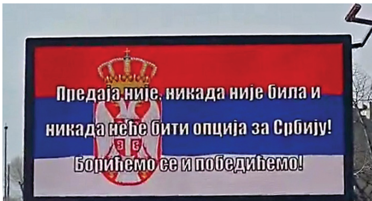
Слика 1. Билборд који је красио улице Београда у јеку епидемије.

ског особља бити заражен, јер у рату „гине највише војника“, 27 шеф државе се служи, у оквиру метафоре, реториком хероја и жртви; али не говори ништа о разлозима због којих би на нивоу друштвене збиље масовна зараза радника у здравству била „логична“. Рат као метафора председнику, заузврат, нуди један колико-толико уређен поредак значења који креира утисак да се ствари крећу грађанима Србије донекле познатим и очекиваним током, да нагли скокови у броју „жртава“ не треба да нас плаше (јер су део „ратних“ губитака, а не одраз ентропије која прети друштвеним хаосом) да „хероји“ обављају свој посао и да ће на крају дана све бити добро.