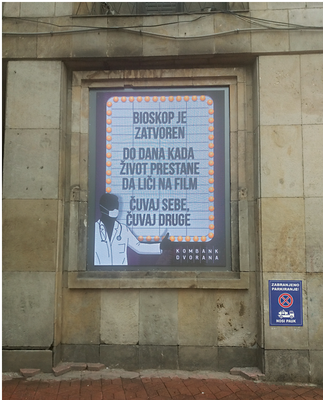
Слика 2. Билборд испред биоскопа „Комбанк дворана“ у Београду.