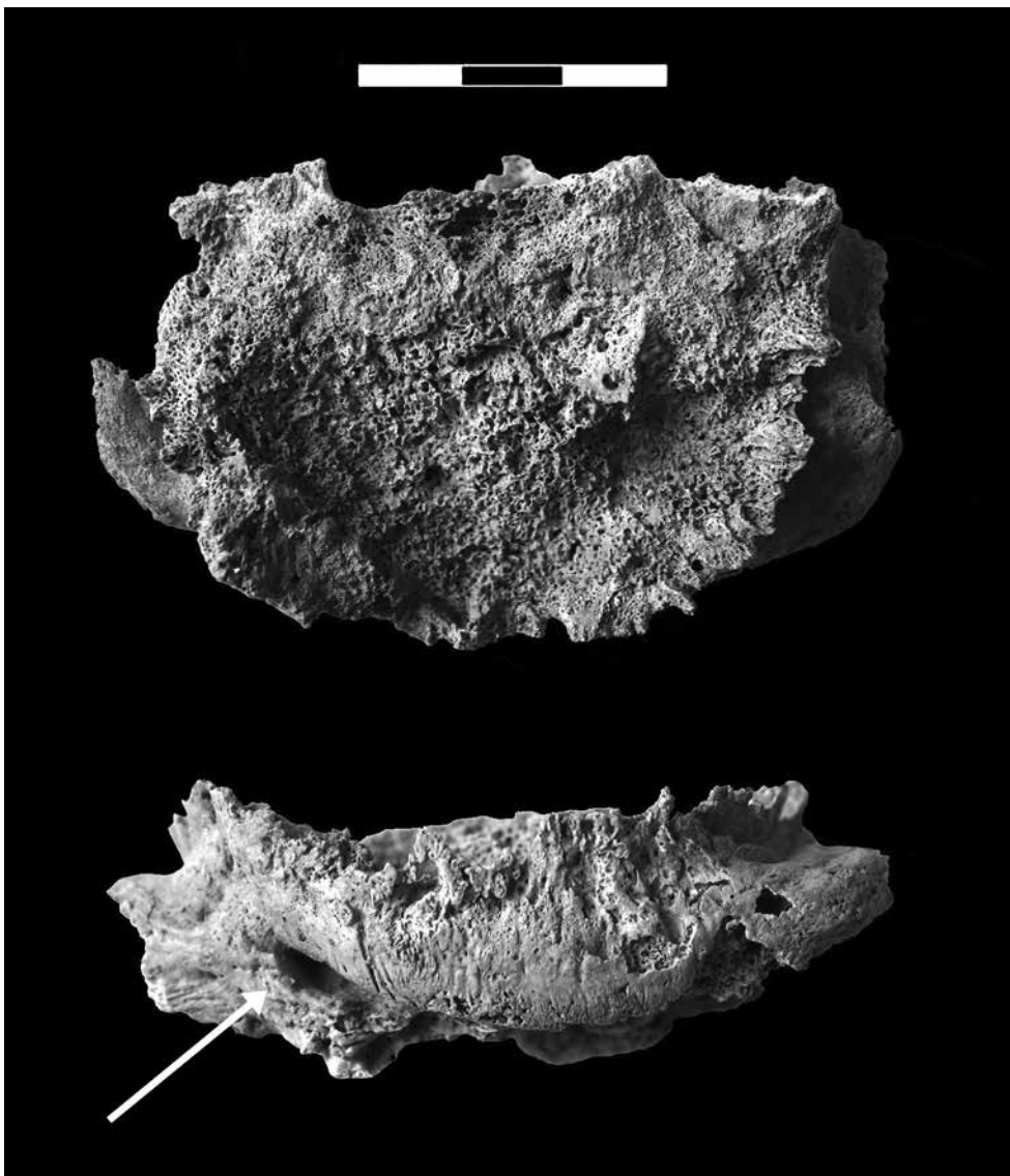
Сл. 3 - Дејенеративне промене на фрајменту лумбалној вршљена. Ситрелица означава фрајмент суседној вршљена који је срасио пролиферацијом коштаног ткива.