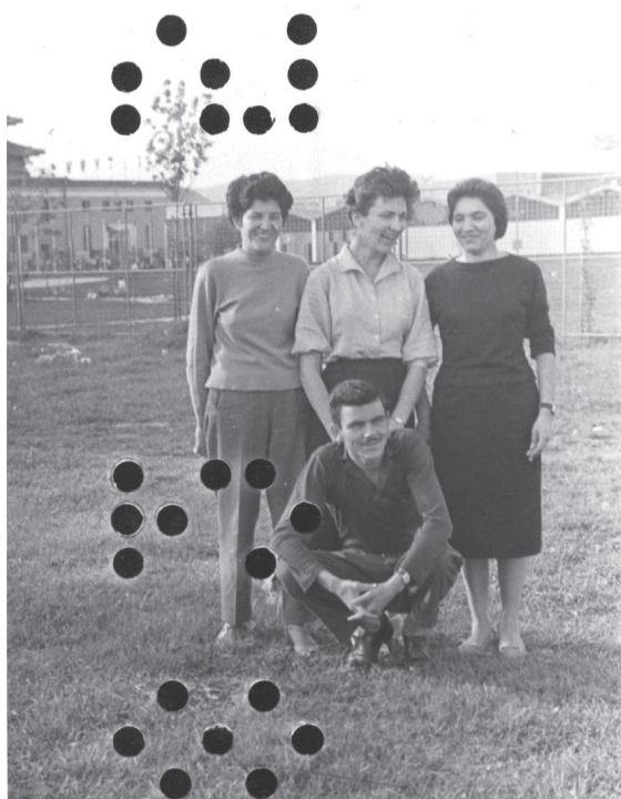
Slika 1. Crno-bela fotografija iz kategorije: Greške u snimanju. Snimanje preko perforacije na početku filma

nedovoljna?, ili: Otkud nezadovoljstvo istorijom? Zbog toga se obnova i refleksija sećanja manifestuju na više načina kao umetnički izraz, filozofska refleksija, naučni projekat, kao i politička akcija i afirmacija kulturnog identiteta“ (isto). Razloge za pomamu za sećanjem istoričar Dejvid Blajt (David Blight) pronalazi u nekoliko bitnih događaja, poput Holokausta (nakon kojeg se moralo oslanjati na individualna sećanja kao izvor saznanja usled uništene dokumentacije) i kraja hladnog rata, koji su promenili sliku sveta i odnos čoveka prema svetu u 20. veku (Блајт 2009, 319–331). Ova pojava ogleda se i u interesovanju umetnika za sakupljanje slika prošlosti, kreiranje ličnih kolekcija i arhiva, pa samim tim i foto-arhiva koji bi se, videćemo analizirajući primer projekta „Talent arhiv“ Vladimira Perića, mogli sagledati i kao antiarhivi, odnosno kolekcije odbačenih slika, koje ponovo sačuvane otevljuju kontrasećanja, suprotstavljena institucionalnim modelima odnosno dogovorenim, reprezentativnim narativima o prošlosti (slika 1).