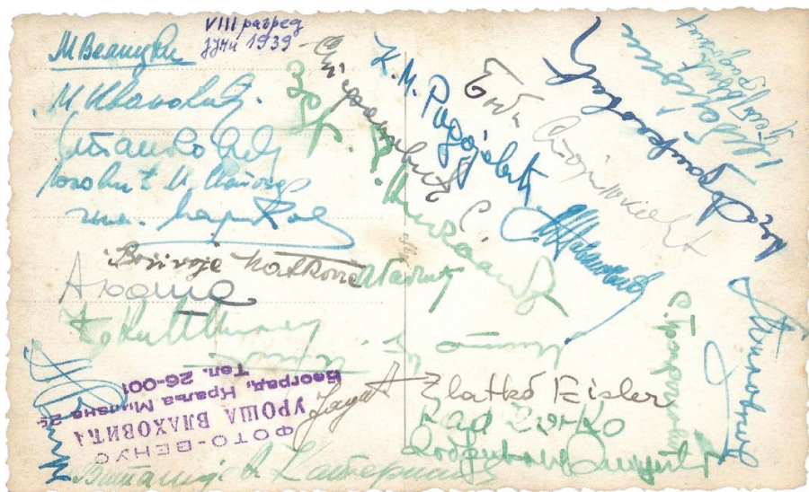
Slika 3. Revers fotografije, potpisi učenika

Ako ovakvo polazište prihvatimo, nije onda neobična težnja umetnika da čuvaju upravo predmete koji su kreirani da nose memoriju, da budu trajna uspomena, iako u nekom trenutku odbačena. Takođe, slojevi prašine i patina vremena samo daju nove slojeve ovom foto-palimpsestu, osiguravaju uzbudljivu biografiju predmeta (slika 3).