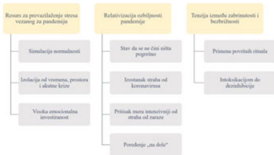
Slika 2. Teme i pod teme prisutne u narativima mladih koji su posećivali žurke tokom pandemije

Žurke su za neke učesnike predstavljale i važan deo identiteta koji imaju osećaj da su izgubili kada su prestali da posećuju žurke. Neki učesnici sebe doživljavaju kao društvene osobe koje često izlaze, te sa nedostatkom ovih aktivnosti sebe ne smatraju celovitim. Za druge je sržna odrednica identiteta biti „klaber”, viđen u klubovima i povezan sa određenim mestima i muzikom, te prepoznat od strane drugih kao neko ko aktivno izlazi na žurke.