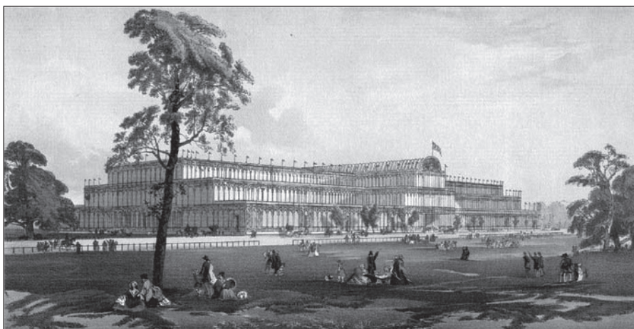
Crystal Palace, Лондон

„Кристални палац“, конструкција од челика, дрвета и стакла, подигнута је за потребе Велике светске изложбе 1851. у Лондону. Ово чудо ондашње науке и технике симболизовало је Лондон као центар модерног света и капиталистичког поретка, којем је, као таквом, припадало да буде домаћин прве интернационалне смотре достигнућа науке и технике, уметности и културе, производње и конзумирања. 2 Том манифестацијом започела је серија l'exposition universelle , које су, и поред промене контекста, увек биле својеврсни форум на којем се потврђивао владајући економско-политички поредак, иницирала нова економска и социјална стремљења, склапали и расклапали међународни односи, огледали друштвени и културни феномени.