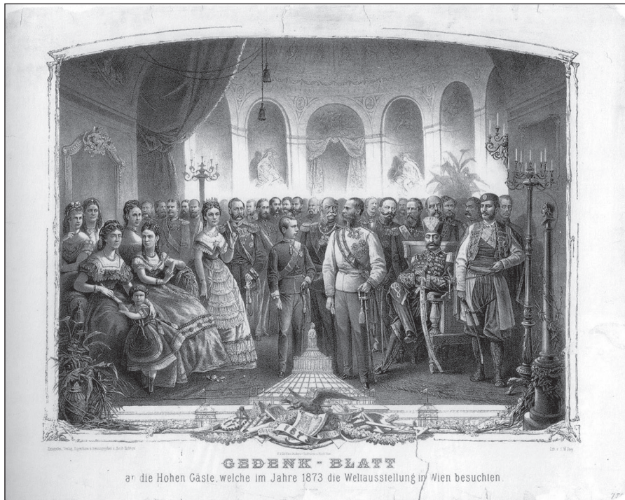
Плакета у спомен Велике светске изложбе у Бечу 1873.

ра књаза Николе, величајног и аутентичног „Другог“, истиче се у пуном сјају, отмености и достојанству у церемонијалном простору слике, симболичном простору царства. Она је презентација уважавања Књаза лично, али и колективног идентитета Црногораца. То поштовање, иако се мора тумачити првенствено у оквиру ондашњих политичких и територијалних претензија Монархије, припада и личним државничким способностима Књаза, као и његовим прецима који су традиционално походили Беч од 1715 (када је у њему био владика Данило), извршавајући државничке дужности и покушавајући да остваре неку добробит за своју земљу. Оно је, великим делом, проистекло и из ауторитета који је у Европи имао Његош, као владика и као песник.