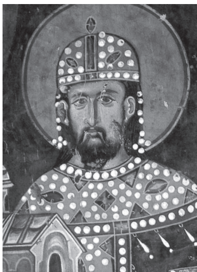
Стефан Драгутин, Ариље

Српски краљ је пришао угарском владару, коме је помогао трупама у бици код Дирнкрута, те присуствовао венчању његовог сина, принца Беле. Услед дипломатских преокрета шездесетих година 13. века и свађе између Беле IV и његовог најстаријег сина Стефана, Урош је покушао 1268. године да се ослободи зависности од угарског краља. Након његове прекинуте кампање, утицај угарских краљева расте на српским територијама. Брак између Каталине,