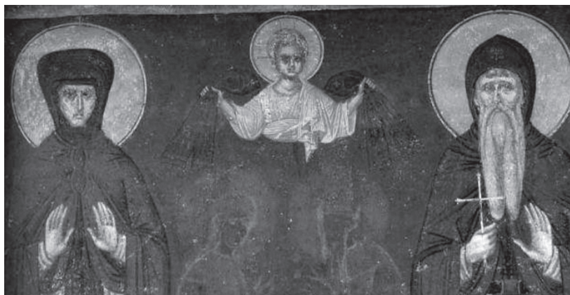
Краљица Јелена, монахиња, и краљ Милутин, монах, Грачаница

од кога је 1282. примио управљање земљом, прикаже идеалним. Мајка која је заступала такве односе и била света, могла је томе користити. 153 Циљ је био да се покаже како је Милутин легитимно преузео престо, без сукоба са братом, као израз Божје воље.