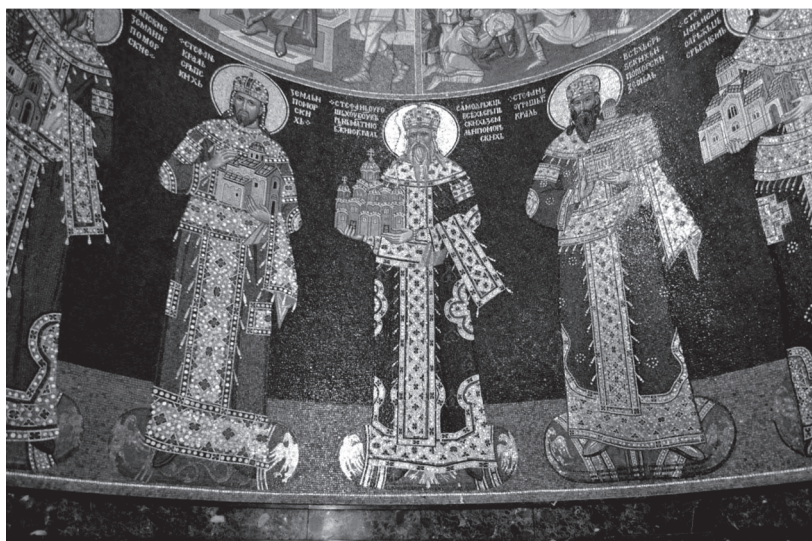
Стефан Драгутин, Стефан Милутин и Стефан Дечански, Црква Св. Ђорђа у Тополи