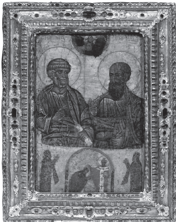
Икона апостола Петра и Павла, поклон краљице Јелене Ватикану

а Милутинов на десној страни. И ватиканска икона, као и она из Барија, резултат су, највероватније, напора краљице Јелене да успостави сарадњу са Светом столицом, у сарадњи са синовима. 111