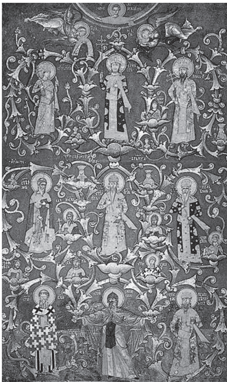
Лоза Немађића, Дечани