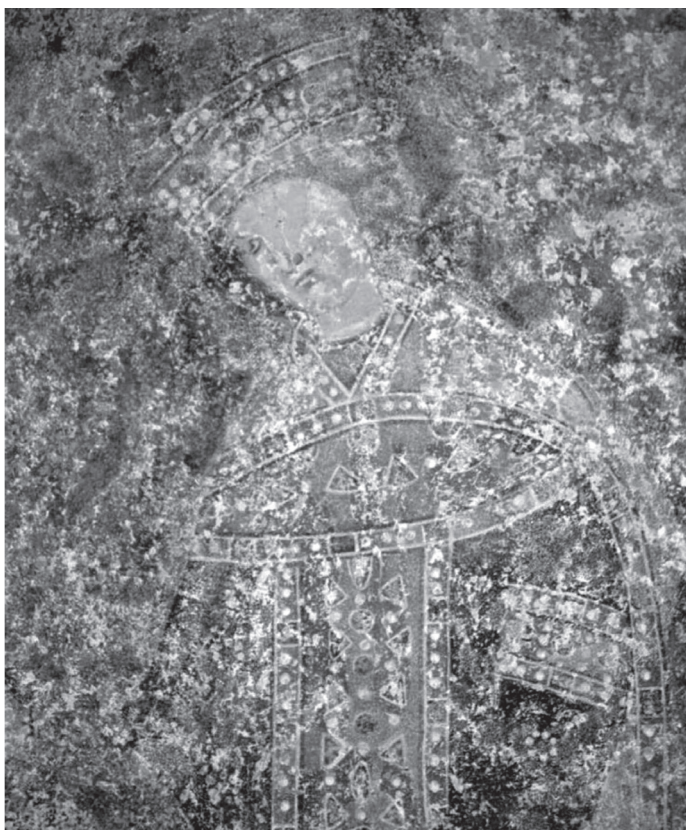
Српска краљица Јелена, Сопоћани

Није јасно да ли је иницијатива за Драгутинов сукоб са оцем потекла од њега или је вођена са стране. Важно би било знати став властеле, а нарочито Драгутинове мајке Јелене, јер је она, као што смо видели, играла важну улогу у политичком животу Србије, као и млађег брата Милутина. Може се претпоставити да је Јелена у сукобу Драгутина и Уроша I била на страни сина. Блиска са угарским двором по вери и родбинским везама, вероватно је подржавала сина Драгутина ожењеног Каталином, угарском принцезом. Он је био подложен утицају