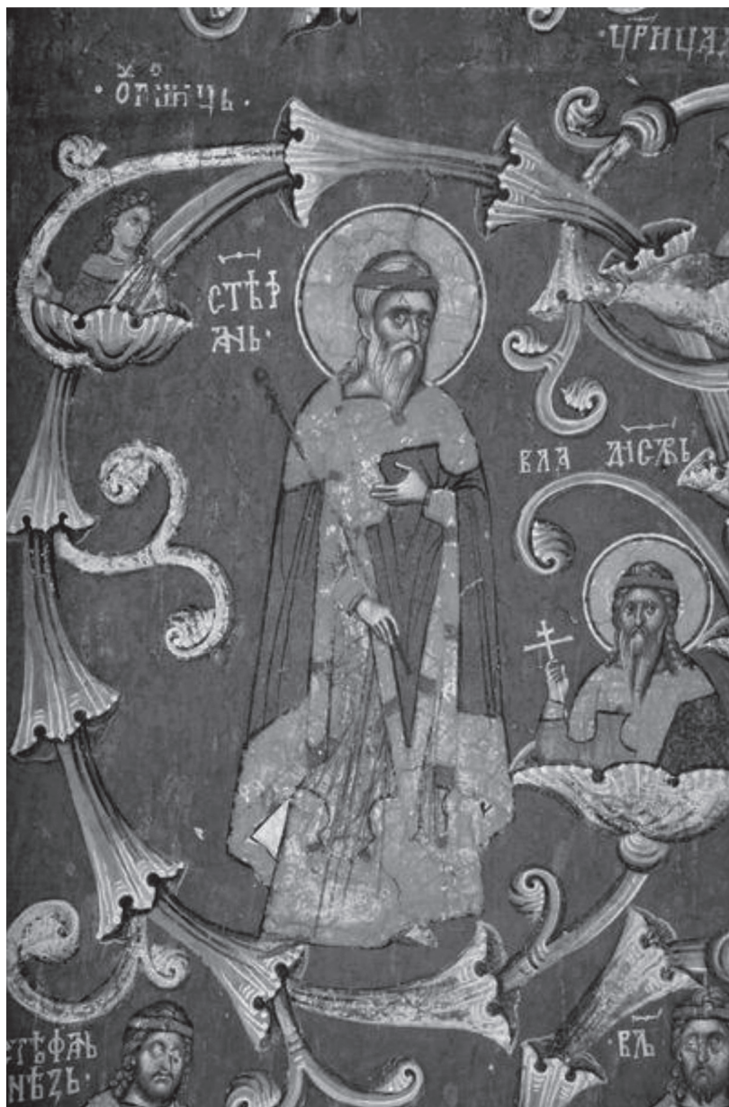
Стефан Драгутин, Лоза Немањића, Дечани