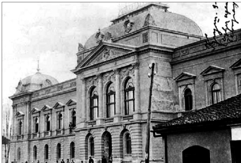
Зграда Начелства, касније Општина, грађена 1900-1904.