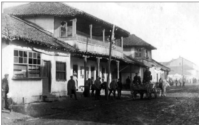
Кућа браће Симића