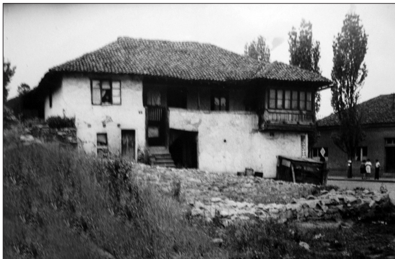
Мензулана у Крушевцу, стара поштанска станица за одмор путника и замену коња, крај 18. века

предложило следећу прерасподелу села. Од Среза козничког би се одузело 21 село: Рогавчина, Бзенице, Стајковце, Плеш, Плоча, Козница, Осредци, Грађани, Крива Река, Мелентија, Рибари, Велика Грабовница, Жиљци, Кочине, Грамеци, Влајковце, Паљевштица, Ливађа, Гочманци, Радманово и Брзеће и присаједила се Срезу јошаничком. У свим овим селима било је укупно до 560 пореских глава. Од Среза трстеничког требало је да се одузме село Гоч, са 36 пореских глава, и придода Срезу јошаничком. Село Стари Трстеник, са 53 пореске главе, одузело би се од Среза трстеничког и присаједило Срезу крушевачком. Од Среза козничког одузимала су се три села: Доњи Ступањ, Горњи Ступањ и Гаревина, са укупно 78 пореских глава, и сједињавала са Срезом крушевачким. Из Среза трстеничког присаједињено је 11 села Срезу козничком: Ново Село, Липова, Врнци, варош Трстеник, Горња Цр-