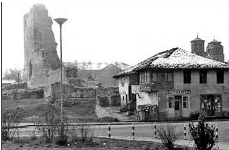
Главна кула Лазаревог града

нишава, Лапаш, Почековина, Оџаци, Доња Црнишава, Дубље, Руђинци. У свим овим селима било је укупно 10.009 пореских глава. Пазарској нахији раније су припадала села Ново Село, Врнци, Гоч и Дубље, а Пожешкој Курилово и Грачац, која су припала 1834. године Срезу подибарском Округа чачанског. Савет се са Намесништвом јула 1839. године сложио са предлогом Начелства, са исправком да села Плоча и Крива Река из Среза козничког и села Гоч, Предоле и Гвоздац из Среза трстеничког потпадну под Срез јошанички. 16