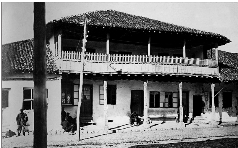
Кућа браће Симића, спреда