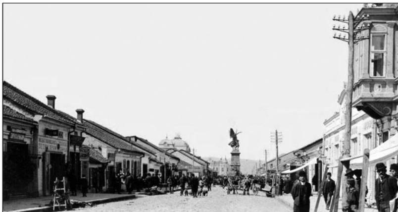
Данас Улица Браће Југовића