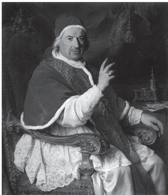
папа Бенедикт XIV

очевитаца. Овакав случај може да почне само пет година после смрти слуге Божијег. „Стари“ или „историјски“ случај се односи на оне у којима се докази о мучеништву морају изнети на видело из писаних извора, и за такве случајеве не постоји временска граница. Централна особа у процесу канонизације је постулатор, кога, уз одобрење бискупа, поставља особа или група која представља случај пред локалним бискупом и која се слаже да сноси моралну и финансијску одговорност за случај. Постулатор надгледа истраге живота, дела и светости слуге Божијег и обезбеђује доказе бискупу о аутентичности случаја и значају за Цркву. Када је дијецезална фаза завршена, постулатор наставља своју улогу током апостолског процеса и мора становати у Риму, где сарађује са Конгрегацијом за питања светих у састављању штампаног тома који садржи опсежно излагање о животу и врлини слуге Божијег ( Positio ), који постаје формални аргумент за канонизацију. 8