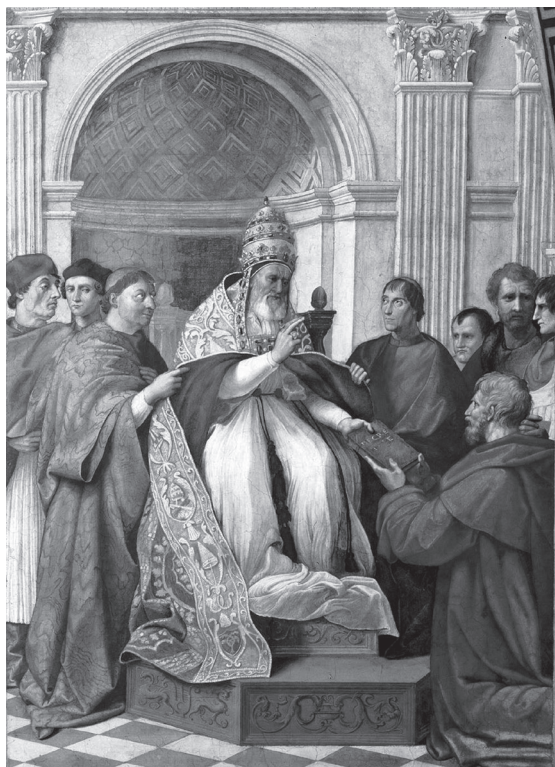
Рафаело - папа Грегур IX

добили јавне црквене почести у 4. веку. 5