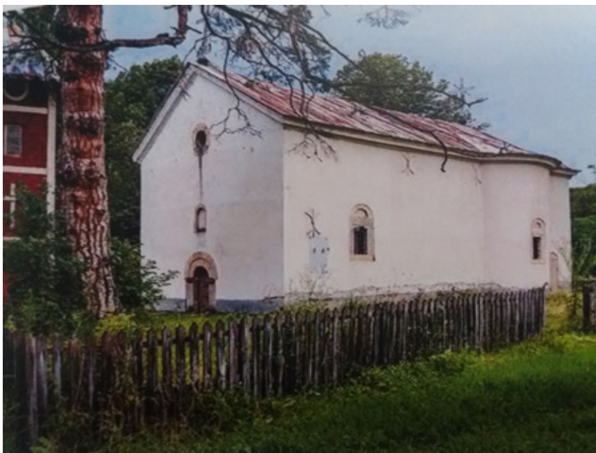
Сл. 5. Црква Светог Димитрија у Брезни, Настас Стефановић, 1837.