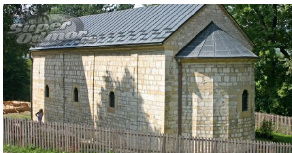
Сл. 9. Црква у Горњој Добрињи, тајфа Милутина Гођеца (Ђура и Алекса Гојевац), 1822.