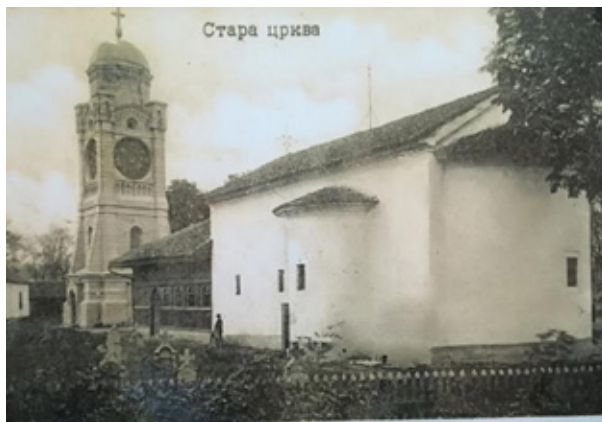
Сл. 8. Стара црква у Крагујевцу, Милутин Гојевац, 1818.

Милутин Гојевац је из Осата прешао у Србију још у време Карађорђа, а био је и један од првих, изузетно ангажованих грађевинара и у време кнеза Милоша. Обновио је манастир Боговађу 1816. године, придворну цркву у Крагујевцу (сл. 8) и цркву у Јагодини 1818, затим у Савинцу 1819, Осипаоници 1826, Шетоњама 1829. године, а радио је и на обнови манастира Чокешине, где је подигао цркву у време између 1820. и 1823. године (Вујовић 1986: 108; Милосављевић 2000: 137–142, 144–145; Несторовић 2006: 123; Костић 2017: 36–37, СТАНКОВИЋ 2018: 132). Као чланови његове градитељске тајфе радили су његови синови Ђура, Алекса и Петар. Ова тајфа градила је храм у Горњој Добрињи (сл. 9), који је 1822. године кнез Милош подигао у спомен на свог оца Теодора