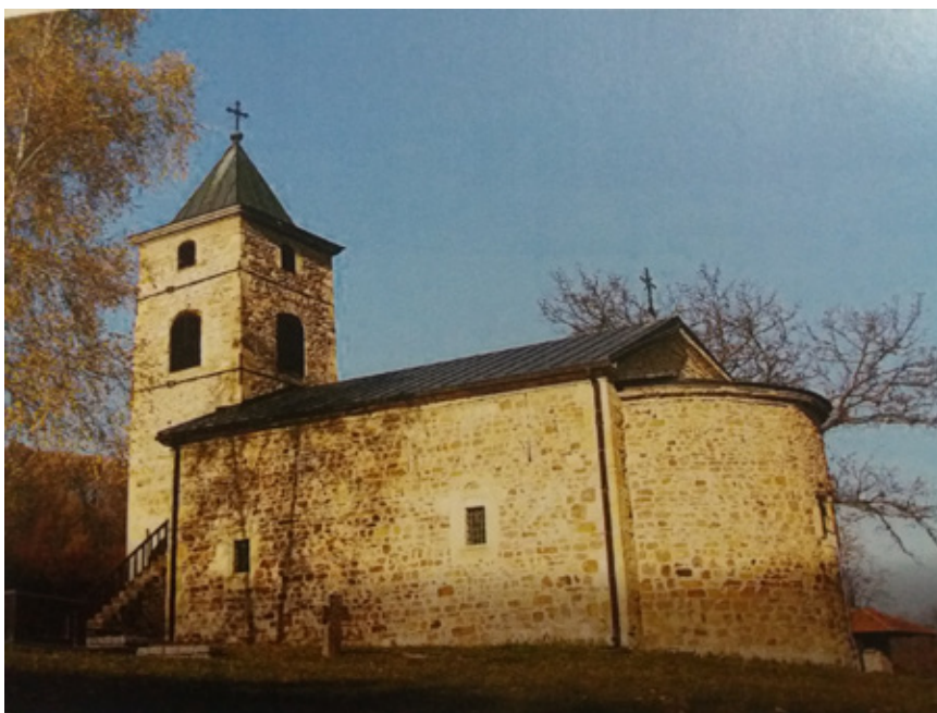
Сл. 6. Црква Светог Николе у Брусници, Настас Стефановић, 1836.