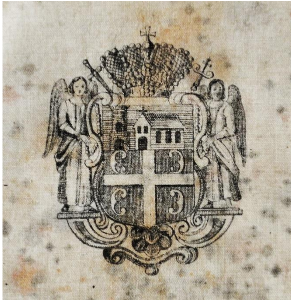
6. Грб Карловачке митрополије, детаљ антиминос Анастаса Јовановића. 6. Coat of Arms of the Metropolitanate of Karlovci, detail of Anastas Jovanović's antimimension.