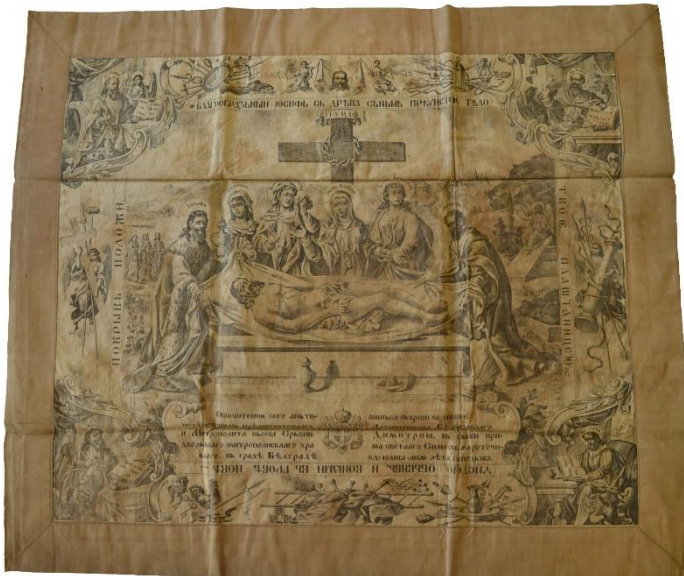
7. Антиминс штампан према предлошку Георга Николаја и Анастаса Јовановића освештан од стране митрополита Димитрија у Београду 1911. године. 7. Antimimension based on the model of Georg Nikolaj and Anastas Jovanović, consecrated by Metropolitan Dimitrije in Belgrade in 1911