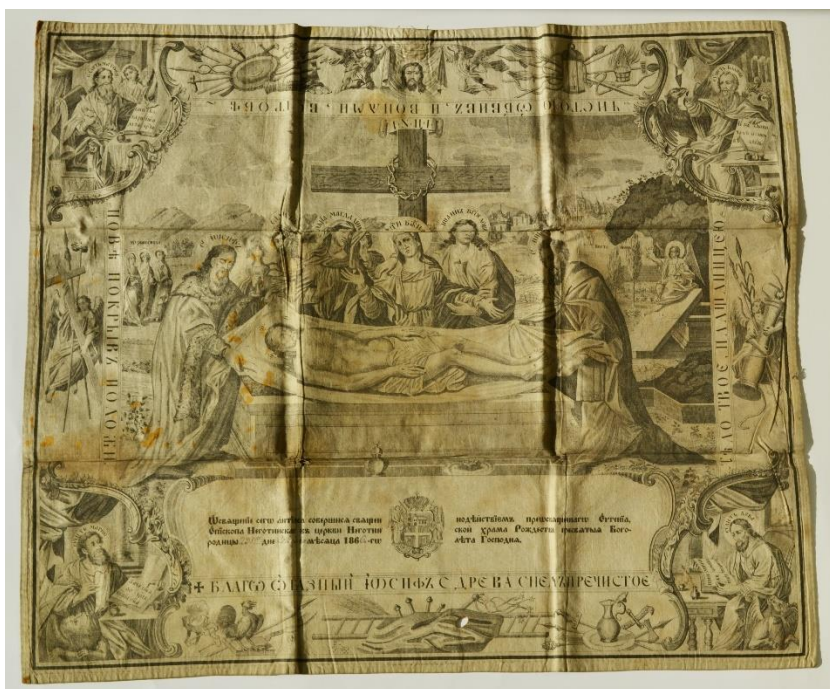
5. Антиминс Анастаса Јовановића штампан за Епископа тимочког Евгенија, 1866. година. 5. Antimension of Anastas Jovanović printed for Bishop Eugenius of Timok, 1866.