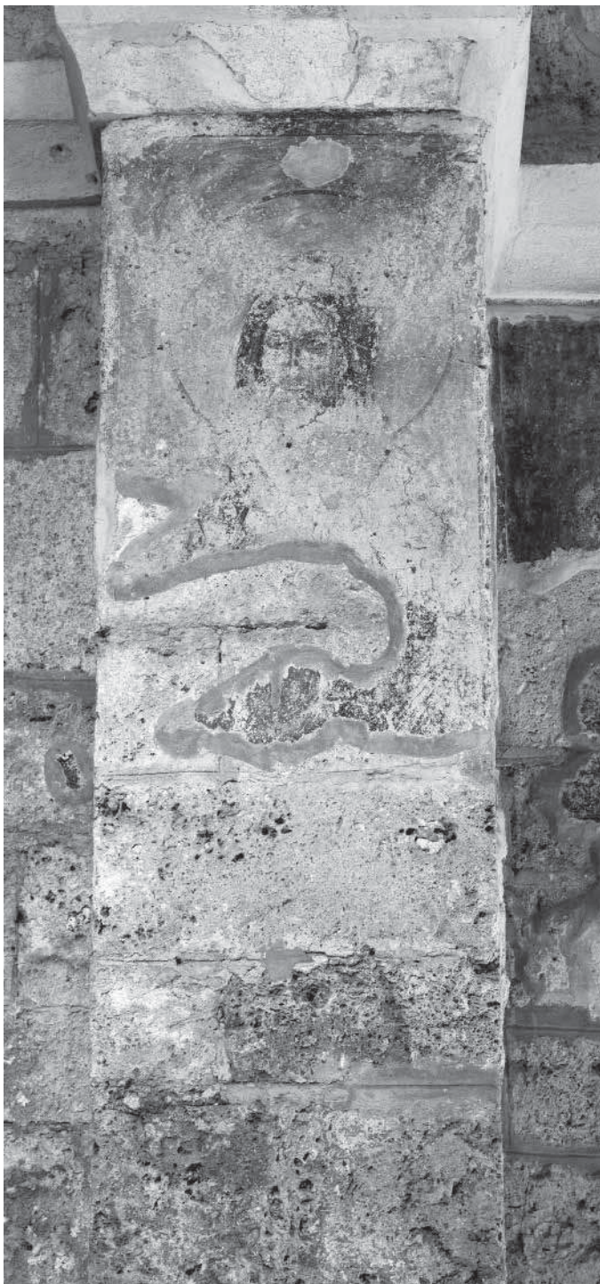
Сл. 11. Свети Алексје Божији човек, северозападни пиластар наоса Fig. 11. Saint Alexis l'Homme de Dieu, pilastre Nord-Ouest du naos

ске групе насликане у градачком наосу и препознати њихове представнике. Ради лакшег сагледавања најпре ће бити речи о фигурама светитеља насликаним у најнижој зони зидова и пиластара, а потом о онима које су сачуване у горњим регистрима, то јест у другој и трећој зони наоса градачког храма.