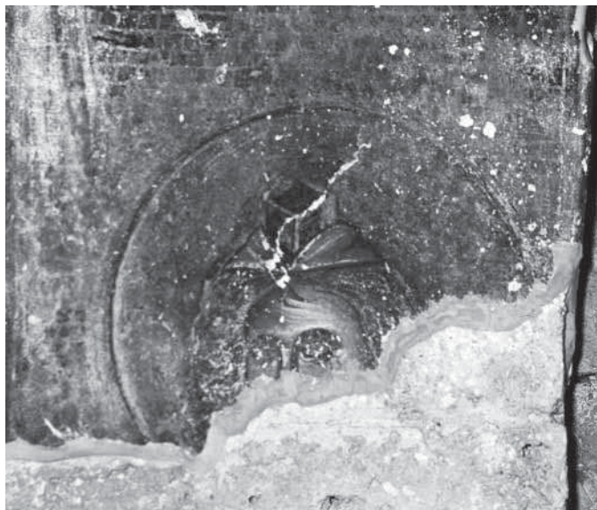
Сл. 17. Пророк Данило Fig. 17. Prophète Daniel

Са становишта програма вредна је пажње недавно идентификована представа Мирносица на Христовом гробу на јужном зиду јужне певнице. Како поменуто композиција указује заправо на Васкрсење Христово, та сцена неретко је сликана у оквиру Великих празника, и то често у непосредној близини Силаска у ад као другог начина приказивања најважнијег хришћанског празника, 95 али и у склопу циклуса Страдања и посмртних јављања Христових. 96 Пре живописања Градца пред-