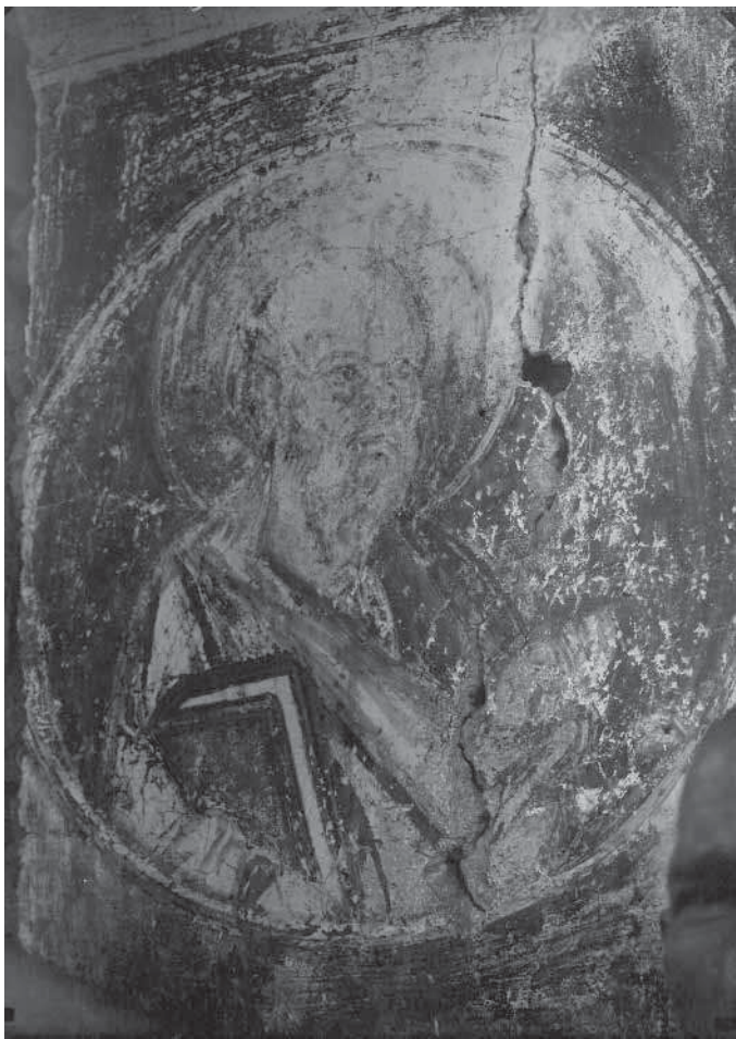
Сл. 15. Свѣѣи Павле Fig. 15. Saint Paul

менти фресака (део нимба и крила арханђела), у којима је најпре препозната представа Благовести, 74 а потом фигуре двојице арханђела — Михаила и Гаврила. 75