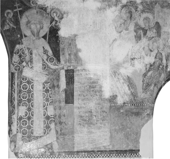
Сл. 3. Кигорски портрет деспота Стефана Лазаревића, црква Свете Тројице у Ресави, око 1418. године.