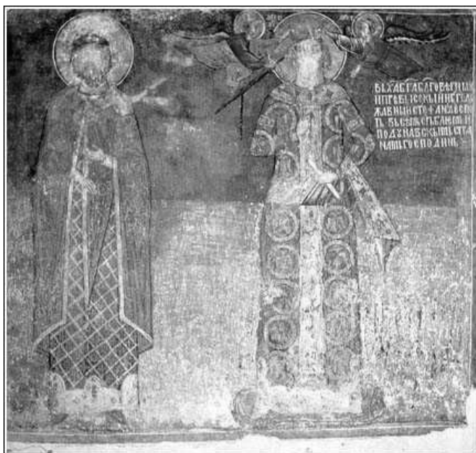
Сл. 2. Портрети деспота Стефана Лазаревића и Вука Лазаревића, црква Богородичиног Успења у Љубостињи, 1402–1405. године.