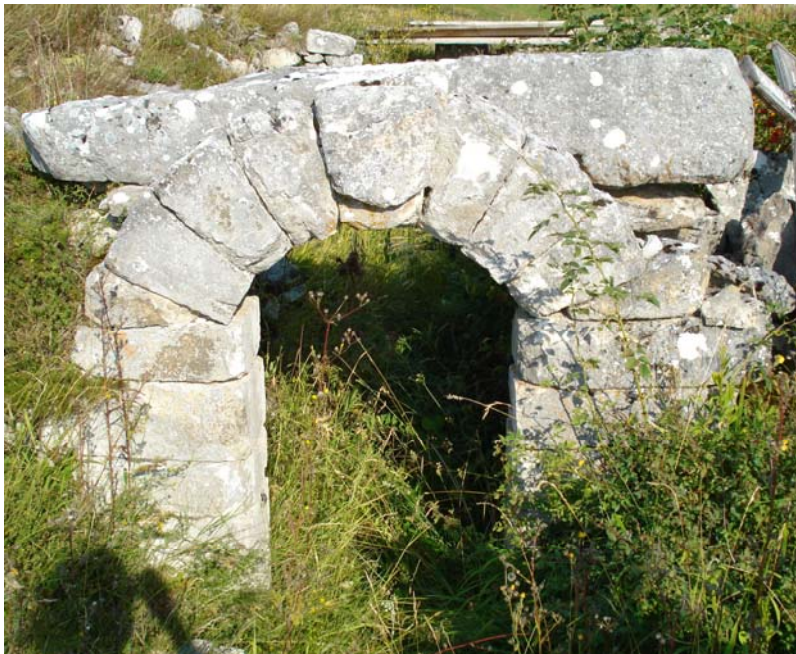
Слика 6: Петрово Село – Надвратник и улаз у цркву Св. Петра