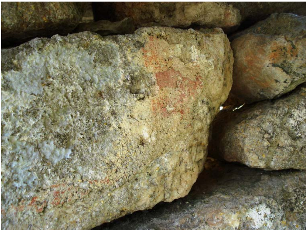
Слика 8: Петрово Село – остаци живописа уз довратник