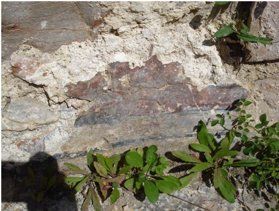
Слика 10: Остаци живописа, Вазнесење, Соколац

Црква је некада имала куполу јер су видљиви и данас остаци пиластара. 29 На ктиторском месту је видљиво улегнуће у поду. Мештани су 2008. године започели самоиницијативну обнову цркве, без претходних истраживања. Том приликом су, по свој прилици, скратили апсиду због нових гробова уз сам њен зид. Зидови цркве са спољне стране нису откопани. Око цркве је активно гробље, а најстарији гробови су покривени монолитним плочама. По причама мештана, ово је била највећа и најважнија црква у Коритима. Била је живописана и посвећена Вазнесењу.