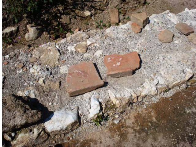
Слика 1: Савино Поље, Црквиште, темељ зида.