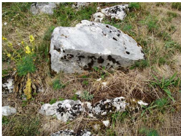
Слика 2: Некропола у Мојстиру испод Црквишта

истраживањима Црквишта и некрополе. У селу нема староседелачког становништва, па ни континуитета. Данашњи становници о овим објектима ништа не знају.