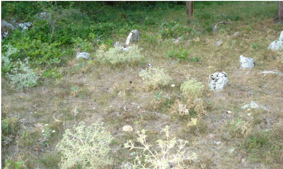
Слика 4: Лагаторе, некропола изнад Црквине

Изнад Црквишта се налази некропола са споменицима – усадницима. Време је тешко одредити, али на основу опште слике остатака цркве, и посебно некрополе, вероватно га треба одредити у нови век. 19 Лагаторе се помиње у турском попису из 1571. године као село које је имало 30 кућа хришћана и 13 неожењених, као и 14 кућа муслимана. 20 У ово време село је било захваћено исламизацијом.