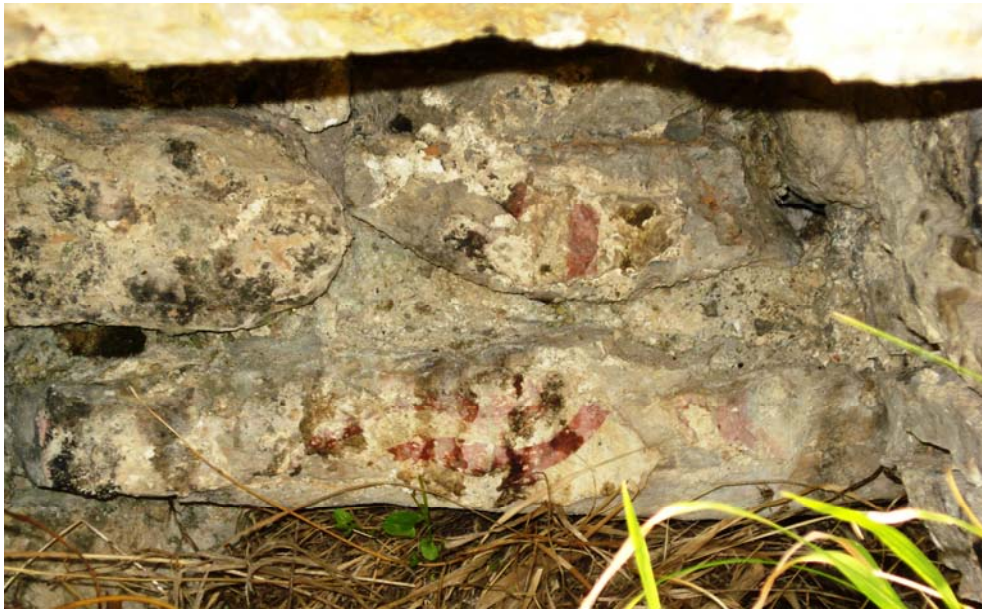
Слика 7: Петрово Село – остаци фреске у ниши поред ђаконикона