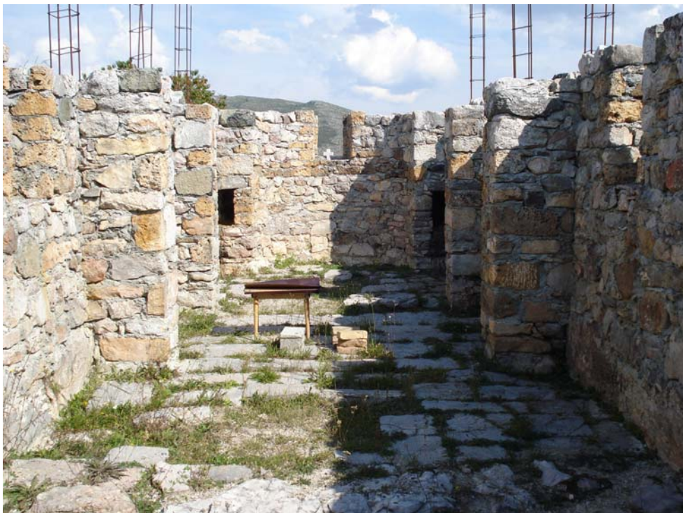
Слика 9: Соколовац изнад Османбеговог Села, црква Вознесења

Изнад Петрова Села, на коси Соколовац, на око 2 км од цркве у гробљу налази се гробље Дупљака (раније Лепосављевићи) и црква у њему. По предању, цркву је зидао неки богат човек из рода Козодери, који су се 1809. године одселили у Шумадију. 28 Основа цркве је 4 са 13 метара, а срушена је после Првог српског устанка. Мештани су између два рата подигли нову, коју су у току рата срушили муслимани.