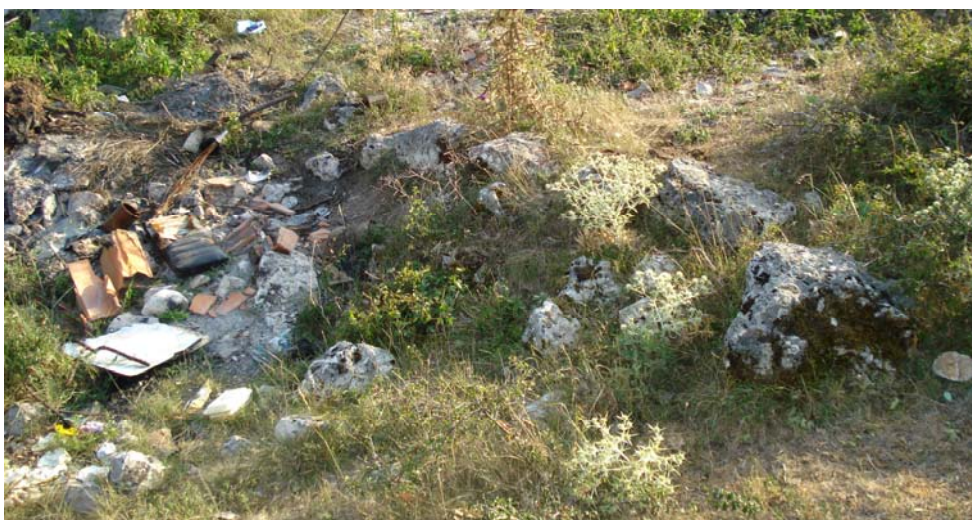
Слика 3: Лагаторе, Црквина са остацима темеља цркве

Судећи по имену, и село Лагаторе спада у старија насеља. Село се налази у доњем току реке Попче. Кроз њега је у прошлости водио пут из Полимља у Рас (Нови Пазар). Данас се у њему налази најстарија цамија у Горњем Бихору. У селу постоје топоними Црквиште и Грчко гробље . 18 Црквиште се налази на изласку из села, на путу за Савин Бор. Видљиви су делови темеља цркве, на јужној и западној страни. Видљив је in situ кречни малтер. Неки од мештана овде бацају отпатке, па је локалитет донекле затрпан ђубретом.